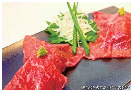
黒毛和牛の肉寿司(ニクズシヤ)