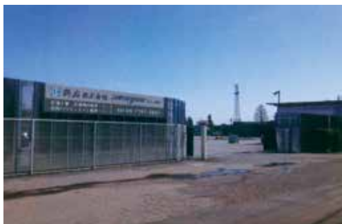
千葉野田資材センター 所在地:野田市目吹横山100番地

また、同社最大の強みは、神奈川県綾瀬市、藤沢市、千葉県野田市に設置した敷地面積延べ25,000㎡におよぶ資材センターだ。枠組で500,000㎡、クサビ組で200,000㎡のぼる自社の保有資材が、関東全域でのスピーディーな対応を可能にしている。この県下トップクラスを誇る事業規模こそ、競合他社に負けることなく受注を獲得し続けている要因だろう。 安全 (Safety)、安心 (Relief)、迅速 (Speedy) の3Cを経営理念に掲げ、中でも、人命尊重と安全衛生を会社の基本方針として大切にしている。「足場工事とは、新たな空間を創造するための舞台づくりです。これからも、高い技術力で安全・安心・迅速を基本とした舞台づくりのエキスパートをめざしていきたい」と小林社長は思い入れを語ってくれた。