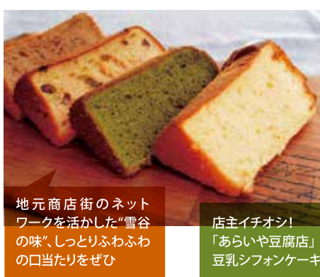
地元商店街のネットワークを活かした「雪谷の味」、しっとりふわふわの口当たりをぜひ

プレーンに加え、アールグレイ、チョコレート、完熟バナナ、西尾抹茶、グレープフルーツなどの豊富なフレーバーの中から日替わりで常時5〜6種類をラインナップし、季節限定メニューも用意。地のネットワークを活かして、使用する果物や野菜は採れたて青果を提供する「やさいやふんど」から、紅茶は「ティージュ」から仕入れている。また、店主自慢の豆乳シ