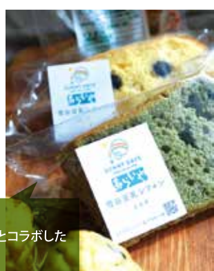
店主イチオシ! 「あらいや豆腐店」とコラボした豆乳シフォンケーキ