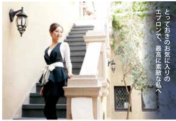
とおきのおきに入りのエプロンで、最高に素敵に私へ