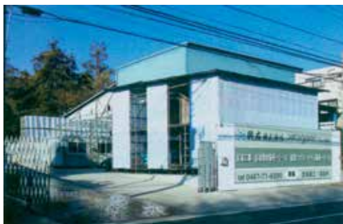
綾瀬資材センター 所在地:綾瀬市寺尾南1-2