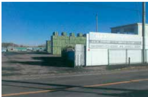
藤沢葛原資材センター 所在地:藤沢市葛原1989-1