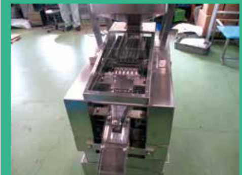
錠剤の厚さ選別機 錠剤の厚さを一定にし、排出する