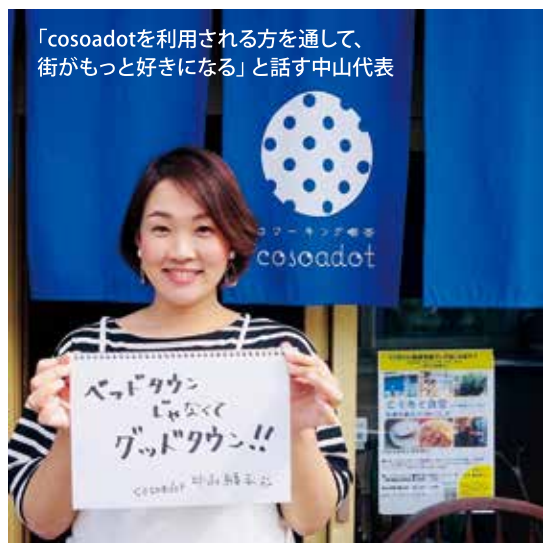
「cosoadotを利用される方を通して、街がもっと好きになる」と話す中山代表

は、中山代表が仕事相談にも乗り、コラボレーションできる先を紹介したり、活動を知ってもらったためのイベントへ参加を呼びかけたりと応援をしているほか、利用者同士の出会いから自然と活動が広がることもある。営業は土日祝を除く平日9時～18時までで、平日夜間と土日祝は