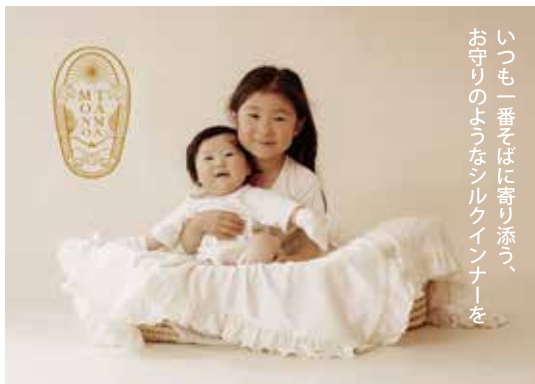
いつも一番そばに寄り添う、お守りのようなシルクインナーを

また、2016年より、新たにシルクインナーブランド「TAMAMONO」もご提案している。冬は暖かく・夏は涼しく、保湿度・放湿性に優れ、人の肌に一番近いシルクを、妊産婦ベビーから幼児期、大人用まで男女あらゆる年代の方に提供したいという想いから誕生したブランドである。最大の特長は、シルクという非常にデリケートな素材ながら、毎日気軽に洗濯機で洗っても長期間の使用が可能になった点である。シルクのよさを肌で最大限に体感していただけるよう、世界で初めてシリコンコーティングなどを施さず、シルク100%でつくり上げた生地を使用している。今年3月には、日常使いや出産祝いにも手頃な、新生児に特化したベビー肌着シリーズを発売予定である。