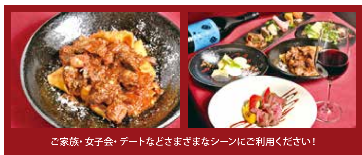
ご家族・女子会・デートなどさまざまなシーンにご利用ください!