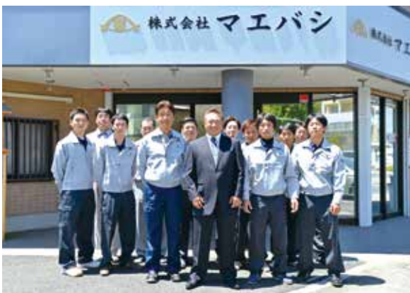
工事のご相談はもちろん、どんなことでもお気軽にお問い合わせください！

同社の強みは、大手建設会社のパートナー企業として、東京都・神奈川県・埼玉県を中心に、高い信用力・技術力と豊富な施工実績を有し、型枠加工・建込み・コンクリート打設及び型枠解体まで一貫して施工対応可能である点だ。