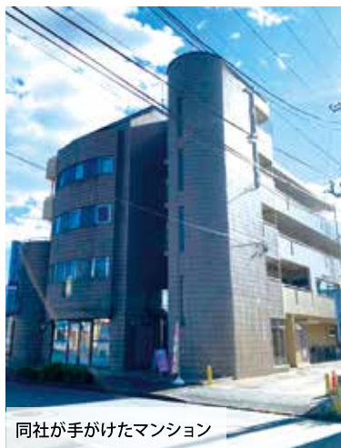
同社が手がけたマンション

二代目の現社長は、「町田をより良い街にしたい」という先代の想いを引き継ぎ、地域活動にも力を入れてきた。町田市消防団に18歳から入団し、副団長を7年務め、2020年秋には藍綬褒章を受章した。