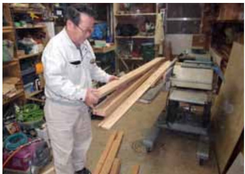
木に対する想いは、どの会社にも負けない