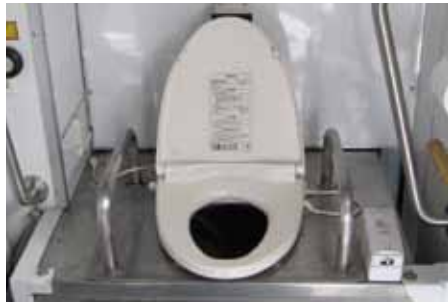
トイレカー内のトイレ、オガクズで分解・処理の為、水が不要

そもそもは主業務である警備の現場で社員のトイレを確保する目的で開発されたものであったが、福祉の現場でも活用できないものかと思案し、障がい者や高齢者でも使えるよう車いす用のリフト機能をつけるなど改良を重ね、現在ではオストメイト(人工肛門などの保有者)にも対応したり、シャワー室完備のトイレカーまで開発している。ホームヘルパー2級の資格を持つ社員も同乗させることで、障がい者が参加するイベントなどでも好評である。