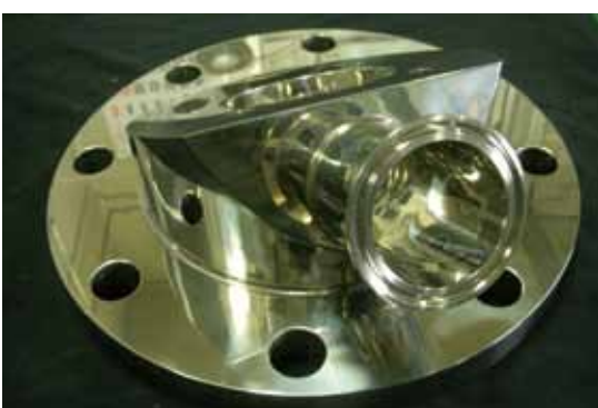
同社が手掛けた医療プラント向けバルブ

るい声で挨拶される。社長の仕事の信念は「挨拶一つから相手に心が伝わるように。そういった日常的な所作は、仕事への取組み方熱意)につながっており、作り上げた製品は職人の心の鏡になる」。職人さん一人ひとりの丁寧な仕事振りは、顧客から厚い信頼と信用を得ている。