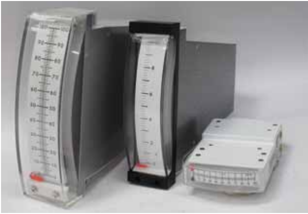
同社の製作したエッジワイスメーター