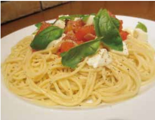
人気の「モッツアレラとフレッシュトマト」

「もっともっと美味しい料理を追求し、美味しかった、ごちそうさま」と皆様に笑顔いっばいと言っていただけのお店にしていきたい」と長坂店主。こだわりとくつろぎが溶け合う地元の人情味あふれるレストラン。また立ち寄りたくなるお店である。