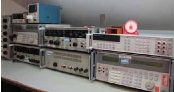
計測器の校正設備