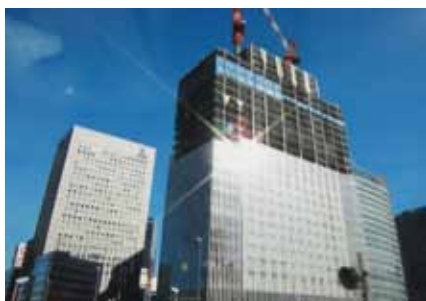
同社の施工現場の一つである横浜三井ビルディング