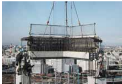
同社の施工現場の様相

は、優秀な技術・技能を持ち、後進の指導・育成に貢献している建設技能者に対する顕彰であり、技術・品質・人材を大切に同社の経営姿勢が評価された結果といえよう。