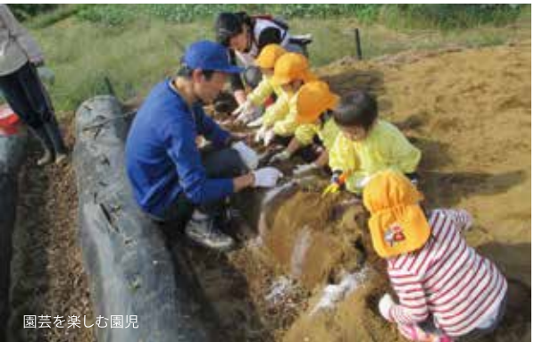
園芸を楽しむ園児