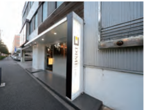
同社のリフォームも、もちろん自社で設計デザインを行った