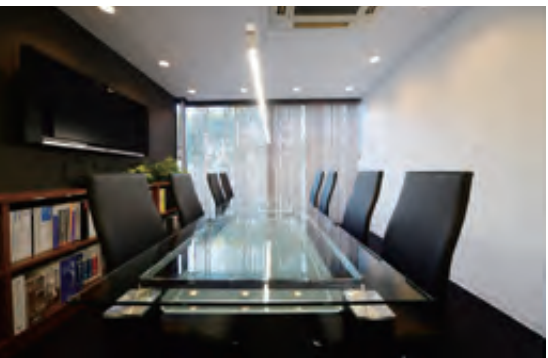
使いやすく洗練された空間に仕上げる技術力

さなお困りごとも容易に解決してくれるので、地元や常連のお客様から「社長に相談したら、なんとかしてくれる」という絶大な信頼を得ている。高齢のお客様からの家電購入に関するお悩みなど、本業以外の相談にも乗る。