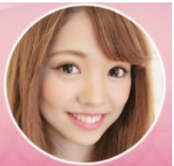
「アニメコンタクトレンズ」(1)を装用したモデル 1.うるるEYE 2.きらきらEYE 3.キラッとEYE