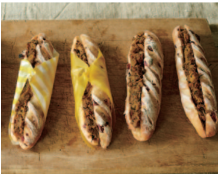
salut!! 看板商品「乾物カレーパン」

子どもにも食べやすいスティッ ク状になっており、揚げていない ので最後までしつこくなく楽し める。