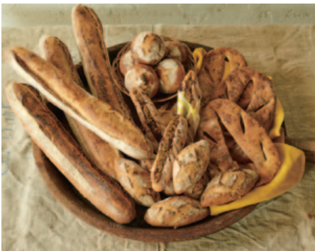
子ども大人も喜ぶ焼きたてパン