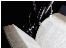
高性能なブックスキャンマシンは、ページめくりも自動！