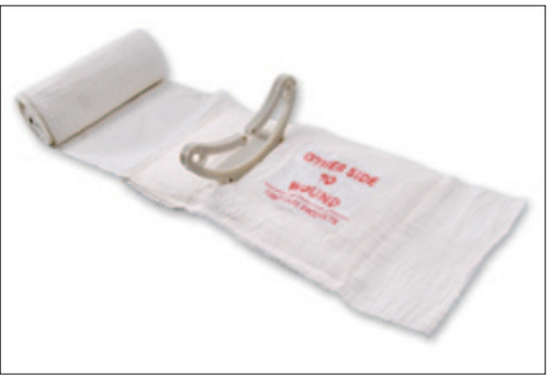
「一人でしっかりと巻ける包帯」

また、新製品として、オーストリア製の「ブックスキャン」の販売を開始した。古文書や設計図など歴史的な価値のある文書や書籍は保存も難しく、劣化や災害による毀損・消失リスクも否めない。そ