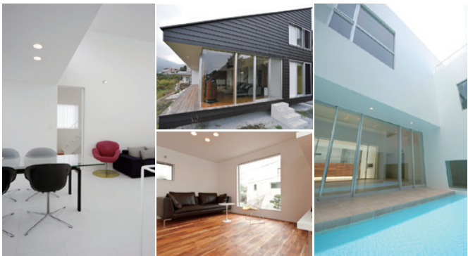
洗練されたデザイン住宅の設計実例