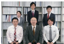
二十一設計 建築設計部門スタッフ 「私たちが、あなたの家づくりをサポートします！」

日本における家づくりの方法は、ハウスメーカーや工務店に依頼するのが一般的だが、実際に工事を行うのは大工さんや電気業者などの「専門工事業者」だ。当システムは、設計事務所のサポートにより依頼主と専門業者が直接契約や発注を行う建築方式のことで、中間業者の一般管理費を大幅に削減でき、ローコストが実現可能となる。