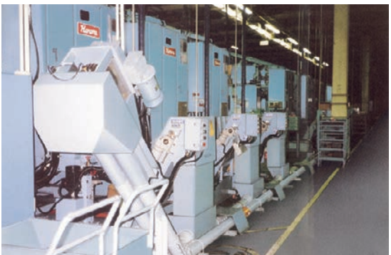
同社の代表的なパイプコンベヤ「パイコン 21」

業種、取扱商品、作業工程、施設、予算など、コンベヤシステムの設計・製造の基本となる複数の条件のうちでも重要となるのが、取扱う製品の幅広さである。お客様にとって最適なシステムを構築するために、設立以来数多くの商品を手がけてきた中でも、特に同社オリジナルのパイプ式コンベヤ「パイコン21」は、水平、傾斜、垂直のあらゆるレイアウトでなおかつ複合