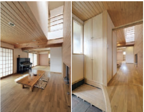
人にも環境にもやさしい家づくり

その一例が、太陽熱を利用した「ハイブリッドソーラーハウス」である。「ハイブリッドソーラーハウス」とは、しっかりとした断熱構造の建物と、太陽の恵みを利用した24時間暖房により、建物全体を暖め、結露、カビ、ダニの発生を抑える、エコで快適な住宅である。太陽熱コレクターによって熱煤液(不凍液)を温め、床下のコンク