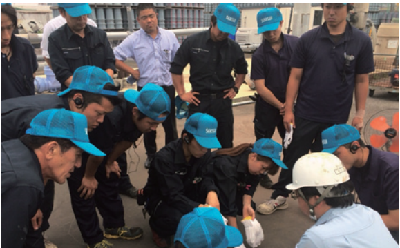
高い技術力で好評を得る同社は、若い社員が支えている