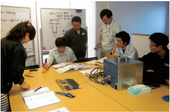
お客様の「イメージ」を「カタチ」へ 社内の技術会議

階の「イメージ」を、お客様の多種多様な要望に合わせて最適な「カタチ」あるものへと提案・設計・製作する。製品価格も数千円から数百万円と、幅広い要求に対応している。