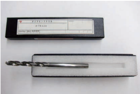
ダイヤモンドドリル

うには超高精度な機械で加工しなくてはならず、その難しさから非常に手間がかかり、生産性は決して高いとは言えない。しかし、無限の可能性を持っているダイヤモンドバイトを活かし「お客様の不可能を可能へと変える」ため、日々研究を続けている。