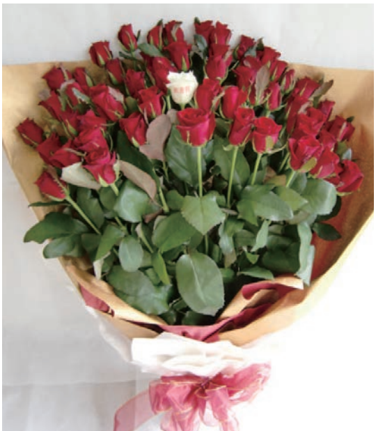
白ばらの花弁に一言メッセージを添えて…

花は突然必要になるケースも多い。例えば、予定していた会食を急にキャンセルしなくてはならない