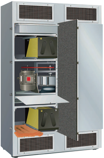
腐食性ガス除去装置

納期の対 応やお客 様のご要 望に沿っ て材質や 形状をか スタマイ ズするな ど、長年 築いてき た信頼に