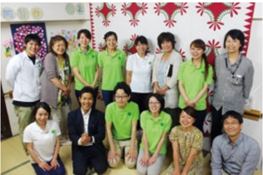
笑顔あふれる職員

喜び、発見、満足、充実を数多く感じながら毎日働く同施設のスタッフならではの自然な言葉だ。