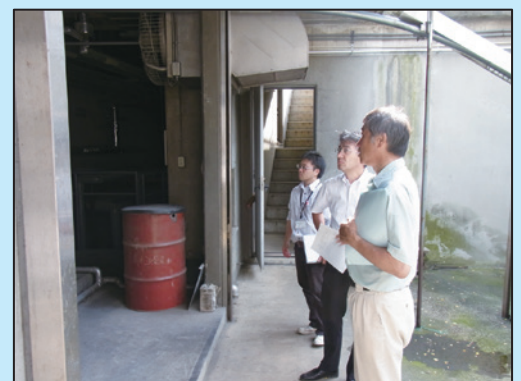
<「ミオンなかさと」のボイラー施設を見学する同所研究員>

この他、同市周辺には、首都圏のJRの約4割もの電源を担っている水力発電所もあり、首都圏のインフラを支えています。