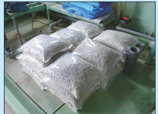
<紙おむつから製造したペレット>

また、現在同市では、使用済みの紙おむつをペレット化して燃料とする実験も行っています。市内の保育園から集めた使用済みの紙おむつを、「紙おむつ燃料化装置」を使ってペレット化し、1年間臭いや劣化状況等を確認しながら保管した後、燃焼実験を行っていく予定となっています。