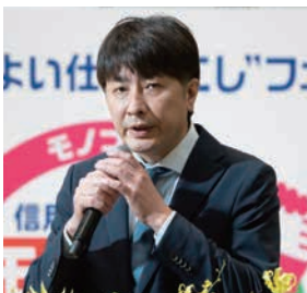
日本アイ・ビー・エム株式会社 様