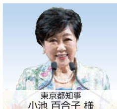
東京都知事 小池 百合子 様