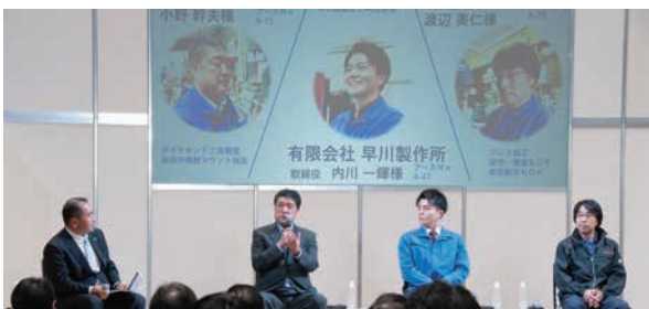
城南ものづくりコンソーシアムサービス