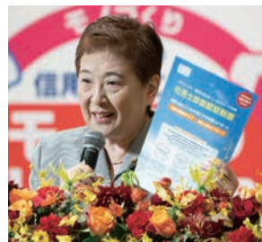
全国社会保険労務士会連合会 様