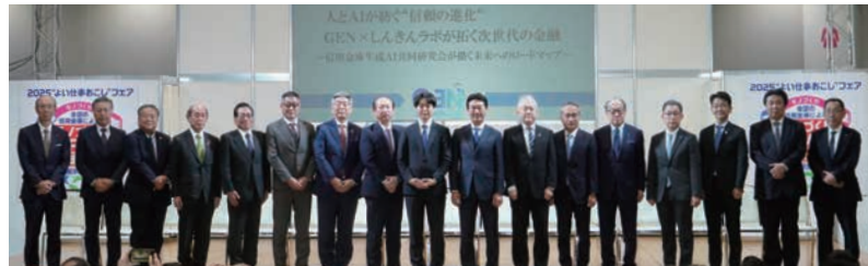
GEN×しんきんラボ supported by neoAI