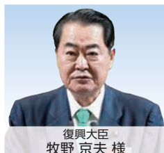
復興大臣 牧野 京夫 様