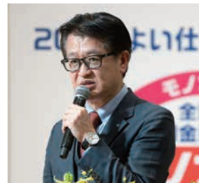
スターツCAM株式会社 様