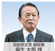
自由民主党 副総裁 麻生 太郎 様