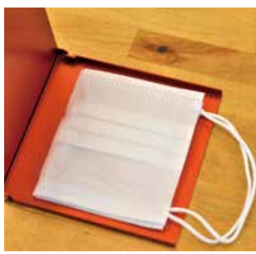
シックなカラーバリエーション（6色：写真はレッド）が揃う『マスクケース匠』 定価10,000円（税抜）

また、食事の際などにスマートにマスクを収納できる『マスクケース匠』は、アルミ素材を極限まで薄く削り、軽く高級感あふれる逸品。どちらでも電子商取引（EC）を活用し、全国に販売を行っている。