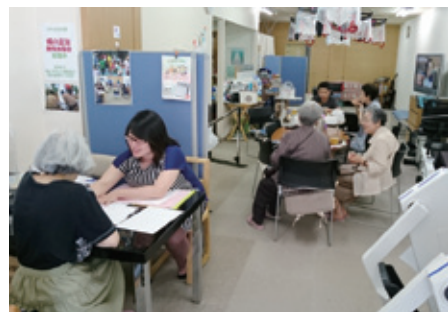
ライラック祭りでのMCI(軽度認知障害)チェックの様子

Comfort Aging AREAから社名を採った。大田区と中野区で、デイサービスや小規模多機能型居宅介護を運営する中で、日々新たなコンテンツの開発に力を注ぎ、介護の枠を超えたサービスを提供し続けている従来にならぬタイプのシニアサポート企業である。 介護保険に基づく食事や入浴、排泄に体操といった介助だけでなく、同社は「mikeetaハッピープログラム」と銘打ち、外出やお泊り旅行、プロ・アマ・スタッフに地域住民も巻き込んだ音楽コンサートや、心と体と頭を元気にする