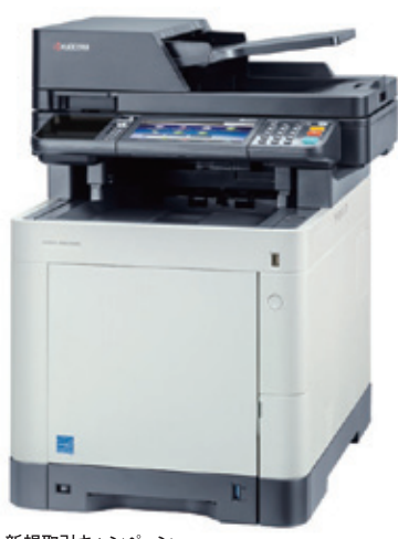
新規取引キャンペーン A4カラー複合機「機器498,000円→0円寄贈」(工事・トナー別)