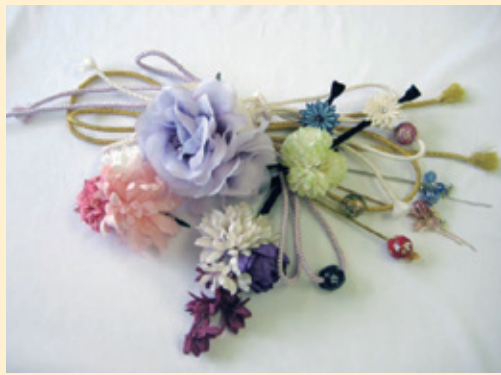
コサージュも各種取り揃えています

できる物づくりをめざしている。中でも同社の特色を感じさせる商品は、和装アクセサリーである。浴衣に合わせるコサージュはもちらんのこと、成人式や卒業式に着る振袖にコーディネートできる華やかなコサージュが人気を集めている。2,000円〜4,000円と、誰もが手にとりやすい価格も魅力的だ。