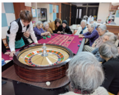
夢中になって笑顔弾けるカジノイベント

と実行力は、同業他社や地域の団体、行政などさまざまな分野からも注目を集め、企画依頼や運営サポート、講演など、直営事業以外にも活動範囲を広げている。地域の方がフィットネスに訪れる「ふらつと久が原」や音楽好きの集まり「音楽ひろば」、地域交流イベントの「カレア倶楽部」の開催や、商店会やNPO主催のイベントでのMCI(軽度認知障害)チェックやスマート脳トレ教室など、同社スタッフの活躍は、忙しい介護従事者の明るい未来を感じさせる。 田口社長が見据えるのは、アジアや世界をも視野に入れた、介護保険制度に頼らない社会づくり。「かつての車や造船、家電のように、日本が世界に翔くチャンスだ。再び日本を世界のトップにした」と意気込む。