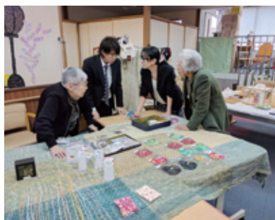
地域交流イベントのバザー