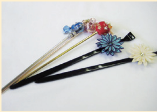
夏場に大活躍！浴衣姿に涼しげなワンポイント