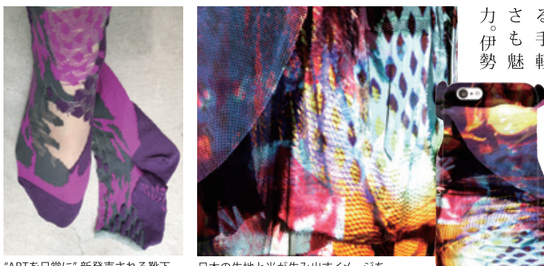
“ARTを日常に”新発売される靴下 (3型各2色)。予約受付中

代表作のプレインコーニスス カーフ「登録意匠」は、和歌山県の ハイテクニットに、ギリシヤの海 辺からインスパイアされたデザイ ンを掛け合わせた服にもなるス カーフである。伸縮性のある綿素 材を蛇腹にカットした四角い布 は、まるでウェアラブルアートの ように比類ない存在感を放つ。着 る人のスタイルや場所に合わせ て何通りもの着方ができ、家で洗 える手軽 さも魅 力。伊勢