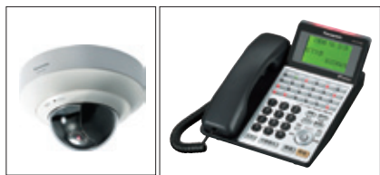
その他、カメラ、電話機など同社の取扱製品

また、新規取引の特典として、「A4カラー・モノクロ複合機の機器498,000円→0円寄贈」(※搬入・開梱・設置・設定・調整・試験・梱包持帰実費50,000円※ブラック・イエロー・シアン・マゼンタトナー実費50,000円)のサービスも行っている。どうぞお気軽にお問い合わせください。