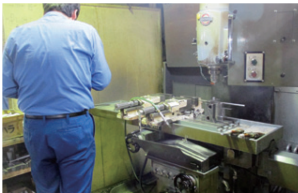
羊羹自動包装機の製造工程