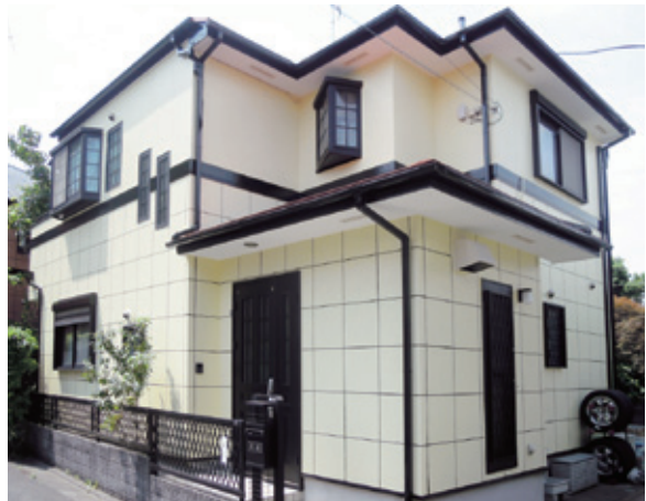
外壁塗装の施工後

現在、屋根には夏の暑さに対応した遮熱塗料をお薦めしている。さらに、JAXA日本の宇宙技術から生まれた最先端の断熱塗料ガイナも取扱っており、お客様のニーズに合わせた最適な塗料をご提案す