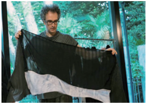
日本独自の生地の魅力を世界へ発信するミハイル社長

丹新宿本店や阪急うめだ本店の 期間限定店、等々力溪谷の中にあ る完全予約制のアトリエショッ プ、ウェブストア( http://store.michaelgknis.com )で販売し ている。 着る人と機屋の直接の交流を 大切に素材にこだわった一点モ ノなどのスカーフで日本の生地 の素晴らしさを伝えながら、「世 界中で日本でしか作れない技術 がいくつもあつた。本当に気に入 たものを長く大事に着る価値観 を広げていきたい」と社長は語 る。 創作活動の他に、布とプロジェ クションマッピングで表現した アート活動も展開する。その幻想 的なイメージはスマホケースや ポストカード、靴下などに落とし 込まれ普段使いできる。日本の生 地に魅せられた社長は、世界を視 野に、技術の維持継承として日本 とギリシヤをかけあわせた新し い匠の技に挑戦し続けている。