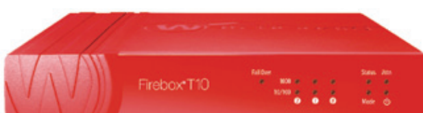
「Watch Guard」無料お試しデモ 365日24時間バージョンアップ「オフィス丸ごとセキュリティ」