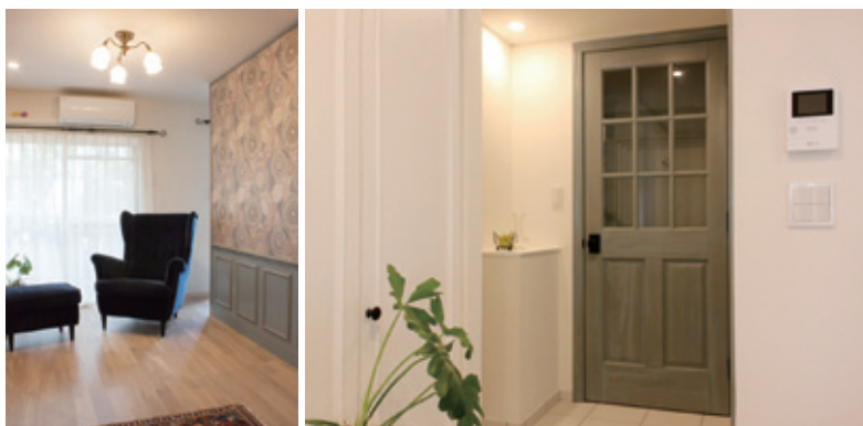
デコラティブなデザインでも機能性を大切に同社の施工事例

量産されるデザインではなく、 「確かな品格を備えたデザイン」を 基本に、住宅も店舗オフィスも、モ ダンなものからデコラティブなり フォームまで手掛けている。中で も、ヨーロッパや日本の伝統様式