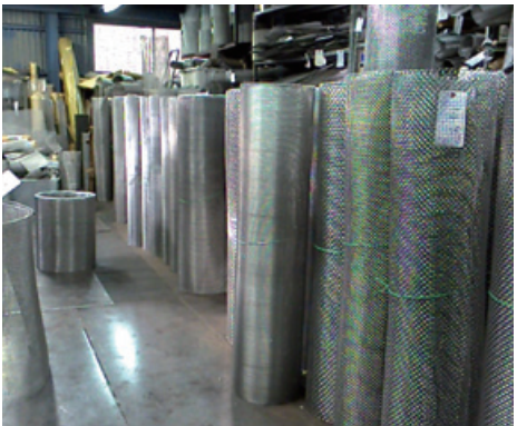
豊富なストックで、迅速に対応することが可能になっている

対応している。直接人目に触れることの少ない製品であるが、自動車・船舶・宇宙開発・空調機器・樹脂・電機・食品・建築など幅広い業界で使用されている。金網製造・加工市場は少量多品種であり、よりよい製品を提供するために材質・加工形状・柔軟性や強度・耐久性や通気性・通水性・製品規格・加工方法などをお客様と相談しながら、細かなニーズに対応できるよう、社員もそれぞれの持ち場で「知恵を出し・汗を出し」業務の向上に日々努めている。