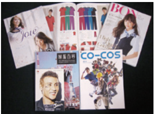
取扱い製品カタログ