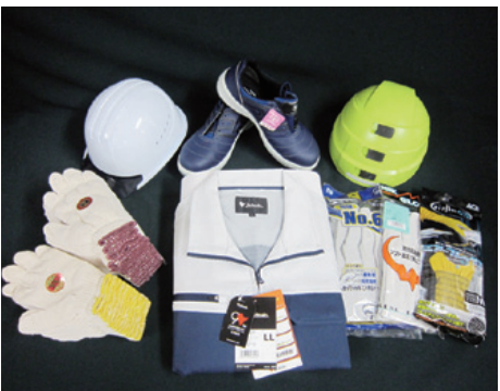
ワーキンググッズ各種

立当初からの理念であり、2代目である現社長もその想いを大切にしている。その結果が、業歴や取引先数、そしてお客様の満足につながっている。