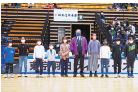
フリースロー対決 参加者