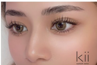
kii eyelash salon