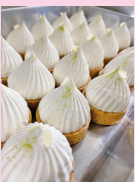
とろけるぶちレモンタルト

コロナ禍により結婚式等 行事が減少し、オーダーが減 少したことからオリジナル ブランド商品『とろけるレモ ンタルト』を発表。インター