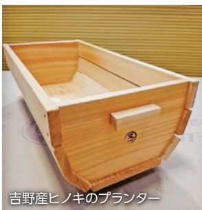
吉野産ヒノキのプランター