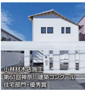
小林材木店施工 第61回神奈川建築コンクール 住宅部門・優秀賞