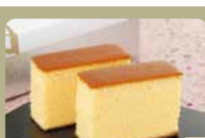
ガス窯ならではのしっとり生地が人気の看板商品『長崎かすてら』

もう一つの看板商品『生ダ!! どら焼（生クリームどら焼）』は、とんねるずのバラエティ番組『食わず嫌い王決定戦』をはじめ、メディアに数多く取り上げられて