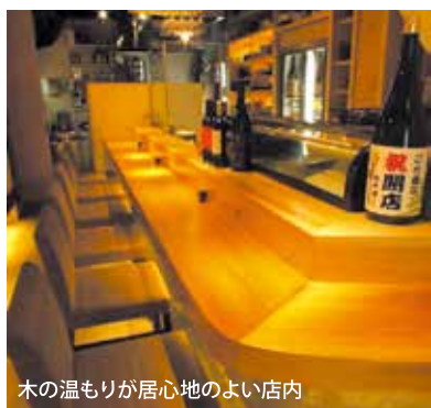
木の温もりが居心地のよい店内