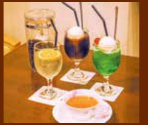
定番のレトロな喫茶メニューの数々も、こだわりの感じる味わいを奏でている。

今後は、ITを活用した新サービスの提供など新しい生活様式への対応も考えつつ、日吉でも数少なくなった喫茶店ならではの味わいを堪能いただけるよう社員・スタッフが思いを