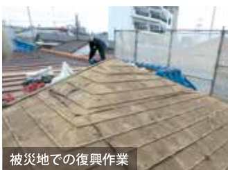
被災地での復興作業

この大切な経験を経て、その後の2016年熊本地震や2018年西日本豪雨、2019年台風15号と度重なる天災にも挫けず全力で立ち向かい、復興対応の技術を磨き、ノウハウを蓄積しながら手がけてきた被災家は3000棟を超える。