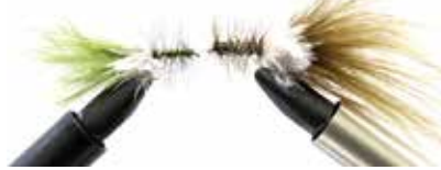
「フライフィッシングキット」今すぐ始めたい人に必要 なものが全部！このキットでぜひ、最初の一尾を