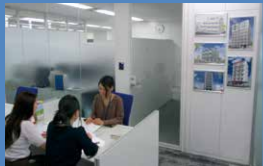
スタッフがオーナー様一人おひとりのお悩みごとを丁寧にヒアリング。最適なプランをご提案します!

フォアライフ・シテイ(渋谷区恵比寿、長野哲郎社長、03-3448-9555、 https://www.4life.co.jp )は、「オーナー様の資産を守り、安心できる不動産管理業務を提供すること」をブランドコンセプトとして、アパート・マンション賃貸管理、仲介、売買を行う企業である。 30年余積み重ねた経験と実績から、オーナー様より管理を任せられた物件は1都3県を中心に1,500棟以上に上る。本社である恵比寿の他に、新宿や神田、元住吉に営業所を構え、8月には横浜支店もオープン予定。