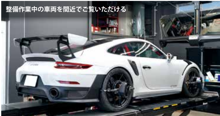
整備作業中の車両を間近でご覧いただける

今まで新車購入、下取り、整備すべて輸入ディーラーにお任せしていたお客様にこそ、一度ご来店いただきたい。ピットには輸入車が毎日入庫し、2階では作業状況を見ながらお待ちいただける。遠方からのご来店でも、多彩な車種の作業風景を直にご覧ください。ここなら任せられると肌で感じていただけるのではないだろうか。