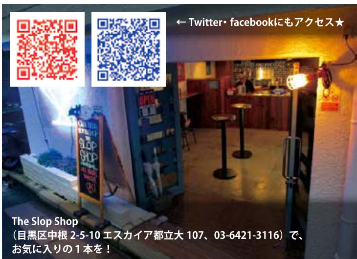
The Slop Shop （目黒区中根 2-5-10 エスカイア都立大 107、03-6421-3116）で、お気に入りの1本を！

また、店内では、ビール他にもオリジナルグッズやビールに造詣の深い楽曲、古書の販売なども行われ、ビールを中心とした文化的なライフスタイルを提案している。