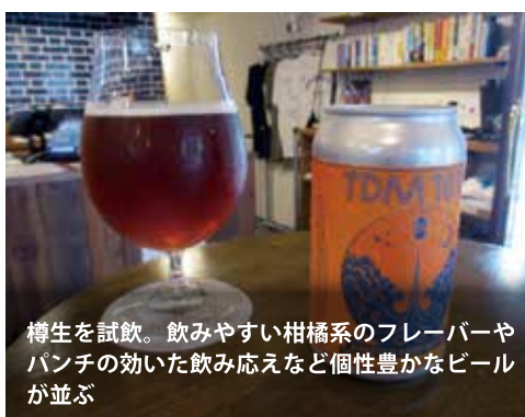
樽生を試飲。飲みやすい柑橘系のフレーバーやパンチの効いた飲み応えなど個性豊かなビールが並ぶ

自分好みのビールと出会った瞬間の感動は、その時の雰囲気をも鮮明に頭の中に刻み付ける。そんな奇跡的で鮮烈な出会いを、ぜひこのショップのビールを通じて体験していただきたい。