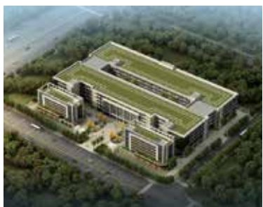
2020年夏に完成する新工場予定図