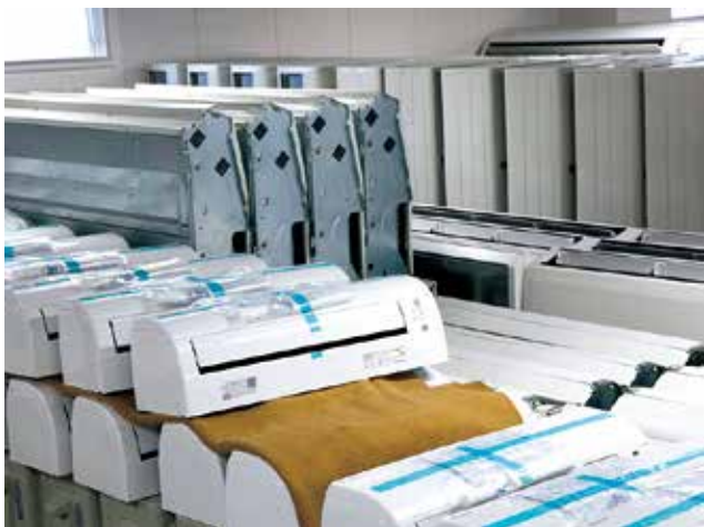
法人問わず、お客様のニーズに合わせた数多くのレンタルエアコンを揃えている

広い工場内の作業や店舗・倉庫・イベント会場といったさまざまなシチュエーションに対応できる臨機応変さ、本部と各支店が連携して即応可能な迅速さ