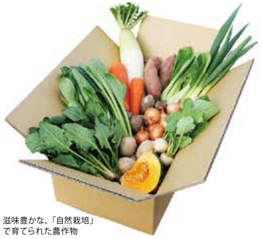
滋味豊かな、「自然栽培」で育てられた農作物

「自然栽培」とは、肥料をあえて使わずに作物を育てる栽培法。作物が本来持つ生命力を最大限に引き出すことで、一般的な栽培では欠かさない農薬を必要とせず、まさに