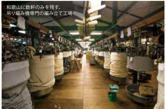
和歌山に数軒のみを残す、吊り編み機専門の編み立て工場

「展示会で『患者は、どこにも歯があり、どこが痛い歯なのか、また、どんな治療法や材料があつて自分には何が適しているのかよく判らない』というご来場者の声を伺いました。事前に口腔内の状態や悪い部位を示すリストを患者さんに渡すことができれば、ご自身の現状が一目で伝わり、よりよい治療選択や質の高い歯科医療の提供につながります」と、社長はシステム開発の動機を語る。「健康長寿社会の実現に向けて微力ながら貢献したい」という強い思いが覗く。