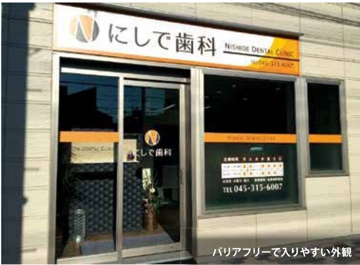
バリアフリーで入りやすい外観

バリアフリー設計の院内は、車いすやベビーカーで来院された方でも無理なく診療室に入退室できるようにになっており、診療中にお待ちいただけるキッズスペースも設置されている。親子3世代で通院されている方も多く、地域に根差した診療、安心して通院できる理想的な医院をめざし、日々研鑽を積んでいる。