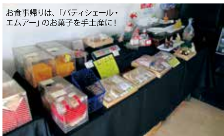
お食事帰りは、「パティエール・エムアー」のお菓子を土産に!