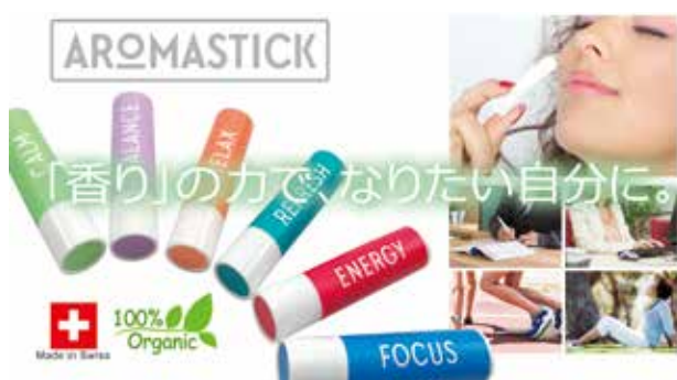
←認知症予防・改善に関する大学の研究成果を参考に精油を配合した新商品「ニンチアルファ」も