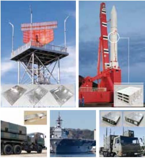
防衛・航空・宇宙開発業界を支える同社の加工部品

「皆様にあまり馴染みのない製品づくりに励んでいます。将来的には、どなたにもお役に立てるような幅広い製品をご提供すべく、今後も社員一丸となり、どこにも負けない精密切削加工技術を蓄積しながら、周囲より少し先を行く努力を日々重ねていきます」と漆間社長は語る。