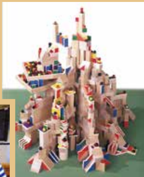
同社の「童具」代名詞、 オリジナルの積木