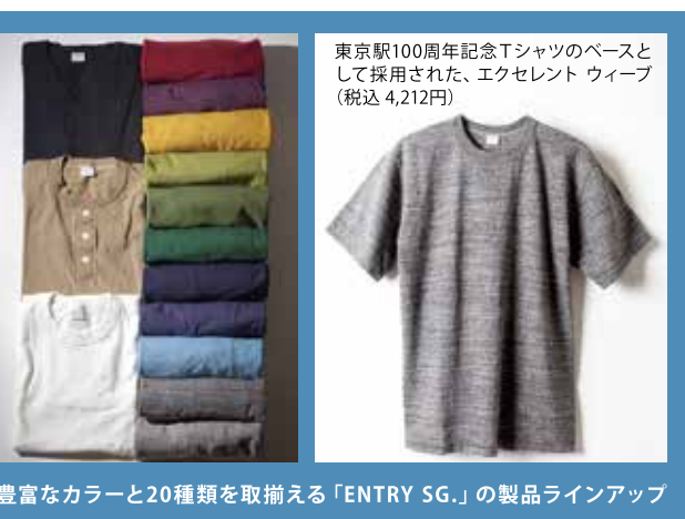
豊富なカラーと20種類を取揃える「ENTRY SG.」の製品ラインアップ

ダブリンイラストレイテッド（大田区西馬込、金刺誠代表取締役社長、03・3775・0408、 http://entrysgonlinestore.com ）のオリジナルカットソーブランド「ENTRY SG.（エントリーエスジー）」は、旧式の編み機を使用した快適な着心地のTシャツが特長である。同ブランドのカットソーは生地を和歌山で編み立て、縫製は東京都江戸川区と希少な純国産90年代までは50%近くあつた国内生産量は、現在わずか2%台まで激減している。国内流通の Apparel 製品は、ほぼ輸入製品といってもいいほどである。