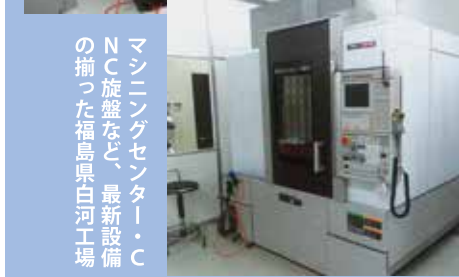
マシンニングセンター・CNC旋盤など、最新設備の揃った福島県白河工場