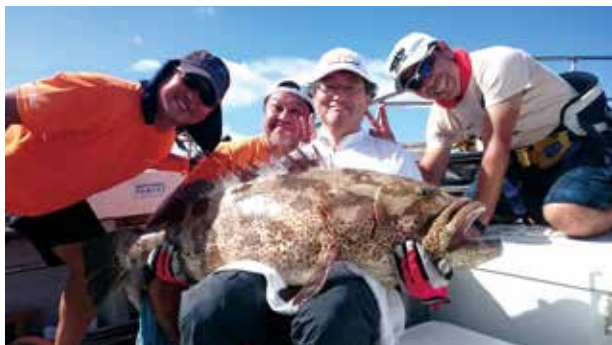
大物釣りで困ったことがあったら…当店にご相談ください！

数々の巨大魚を仕留めてきた代表の厳しい目で選んだ取扱商品の中でも、オリジナル商品のロッドやリールは、材質を厳選し、メーカーと試行を重ねて作り上げた世界にひとつの逸品である。ロッドは完全オーダーメイドも可能。カラーはお好み、