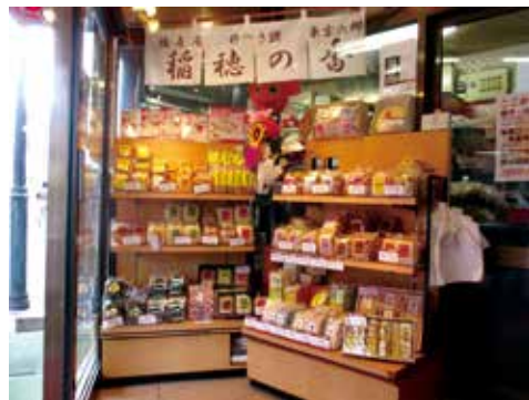
店頭に並ぶ豊富なラインナップ！