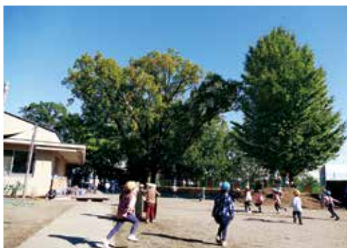
豊かな自然の中で、いきいきとした保育を展開

「両園ともに、生地区からの通園のほか、町田駅からの通園をサポートする「町田駅前こども園保育送迎ステーション」や、町田市受託事業「つながり送迎保育園・もりの」も利用可能。働く子育て世代の心強い味方だ。さらに、今年2月には、クラウドファンディングによる資金でつくられ、シェアハウス・ゲストハウスと保育園が融合した「つながりシェア保育園・よよぎうえはら」が、4月には各施設が連動した「つながりづくり保育園・原町田」が開園予定である。各施設の見学(随時受付中)など、お問合せはホームページへ！