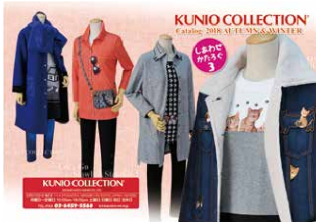
企画デザイン・プリント、コラボレーションやOEMのご依頼も、何なりとご相談ください!

特に、フェイク(だまし絵)プリントTシャツは、お客様から絶大な人気がある。1670万色も揃えたデジタルインクジェットプリントで表現された繊細なグラデーションは、佐藤氏が描く動物たちの細かいタッチから重ね着したかのような生地の陰影までリアルに再現している。また、どの体型の方にも合うように、1mm単位でパターンを調整するなど計算し尽くされたこだわりのデザインや日本の丁寧な縫製技術が、多くのお客様に永年支持さ