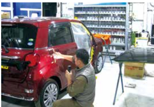
設備や労働環境も、人と環境にやさしく働きやすい

ドックスのスタンドブルー水性塗料を使用することで、よく使われる有機溶剤塗料が発生させる揮発性有機化合物による大気汚染や環境問題にも配慮している。