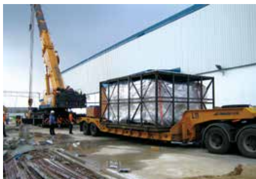
現地にての荷卸し→粗置き