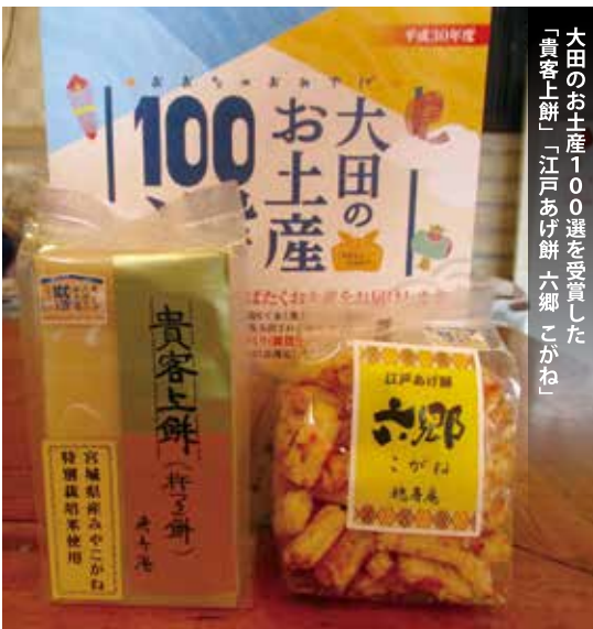
大田のお土産100選を受賞した「貴客上餅」「江戸あげ餅 六郷こがね」

手間暇かけて製造された米菓は各種メディアでも取り上げられており、平成29年は天日干しで仕上げる「江戸あげ餅 六郷こがね」が大田の