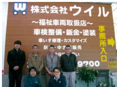
店頭にて、従業員のみなさん

さらに、工場内の全照明、塗装ブース内照明にLED照明を採用してボデイの歪みや塗装の仕上がりを細かく確認でき完璧な修正・塗装を実施しているほか、スタン