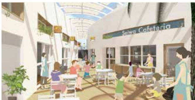
2019年、新園舎完成予定！

1歳児から受け入れる幼保連携型認定こども園「町田自然幼稚園」は、豊かな「自然」を保育の柱として1964年より運営。1,600坪の敷地内の雑木林を活かした広い園地と山林が、子どもたちの探検、探索、発見、感動の場だ。緑の中、躍動感あふれるいきいきとした体験型保育重視の同園で、子どもたちの興味を広げ、深めていく。