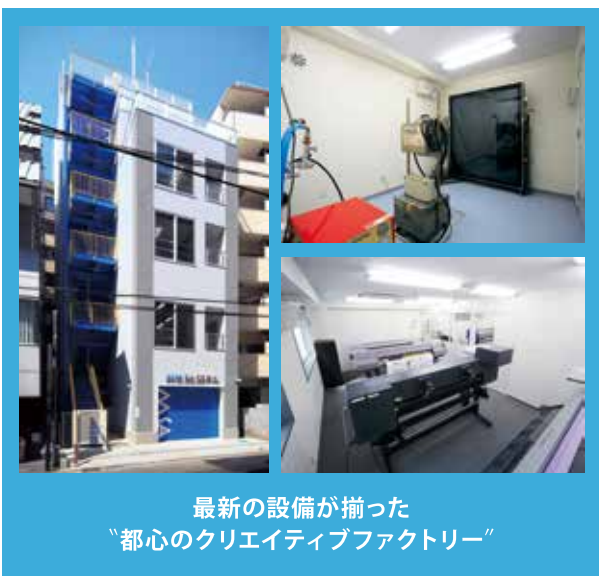
最新の設備が揃った “都心のクリエイティブファクトリー”

同社の技術を利用したサインは、駅の出口や乗換表示、地図をはじめ、今もさまざまな公共交通機関や商業施設で使用され、多くの人々の身近な存在として、生活のライフレインを担っている。