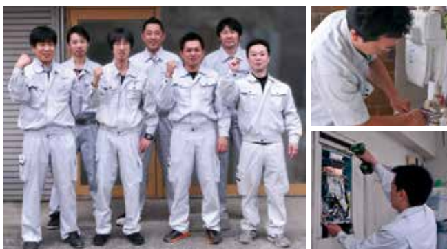
同社を支える多能工スタッフのみなさん

実績を誇る。住まいのどんな小さなお悩みでも同社に相談してみたいかができるのか。気さくな社長をはじめ熟練スタッフの面々が、間違いのないリフォームへ導いてくれることだろう。