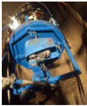
外壁工事をはじめさまざまな現場で大活躍する同社 Gondola

サービス内容としては、仮設 Gondola レンタル、ホバーシステム設置、飛散落下防止養生メッシュシートシステム、オーダー Gondola・特殊機材の設計販売、各種申請 Gondola 操作特別教育講習会の開催などである。