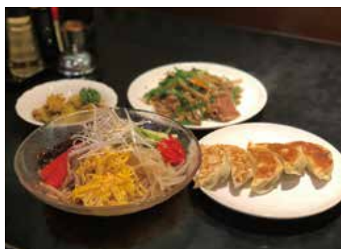
夏場にお勧めの冷やし中華、毎年好評を博している

ること」をモットーに、食材に妥協することなく、さらに長年の経験を活かして「食材の味を引き出す調理」を追求し、より幅広いお客様に喜んでいただけるようなおいしい中華を手頃な価格でご提供している。 冷やし中華も自慢の一品、これからの暑い季節にお勧めだ。尾山台周辺へお越しの際には、ぜひお気軽に駅から徒歩3分の同店へお立ち寄りください。