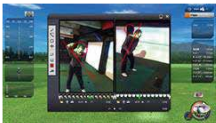
録画で、プレイ中のフォームなどを確認できる