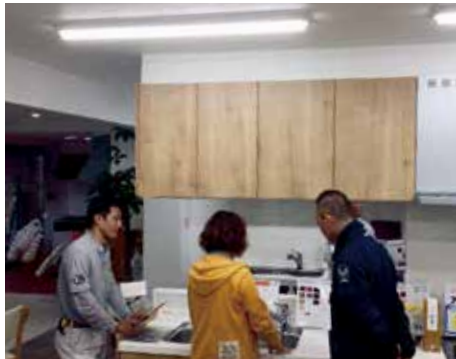
さまざまなイメージがふくらむシヨールーム

と願いながら仕事をしています」と、江崎社長は柔和な笑顔で想いを語る。住まいのお困りごとを、気軽に安心して相談できる心強い味方である。