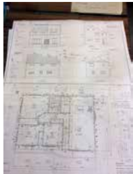
お客様一人ひとりと向き合い、個性を形にしてい