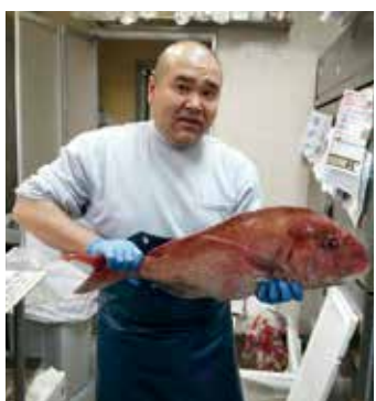
「マザーズこだわりの鮮魚をどうぞ！」

そして、鮮魚スタッフは博多で修業した九州出身の職人である。九州の魚を知り尽くした職人がおいしく捌いてくれる刺身を、ぜひ一度お試しください。刺身盛り合わせのご予約は随時受け付けています！