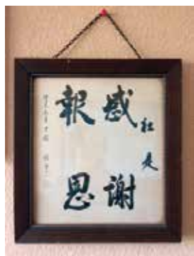
「感謝 報恩」の気持ちを忘れずに