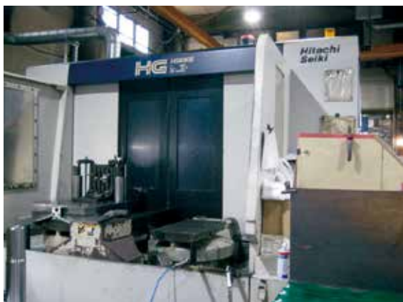
同社備付のマシンングセンタ

削加工、一部溶接を手がけ、その加工技術力の高さから、国内大手メーカーにも部品供給を行っている。同社は、約720坪の敷地に自社工場を所有し、NC旋盤、マシンングセンタなど充実した機械設備のもと、お客様からの要望に迅速に対応できる体制を整えている。ステンレスを中心とした各種材質（HS・C・B、チタンなど）の切削加工が強みで、その強みを活かしたこだわりの製品は、取引先メーカーからの評価も高く、これまで数多くの納入実績を誇っている。また、同社の製造したコントロールバルブ部品は、ビル・工場・造船他各種設備の配管に使用されているが、お客様との打ち合わせに始まり、設計、部品の製作・加工、受入・検査、組み立て、出荷、アフターフォローまでの一貫対応も強みである。