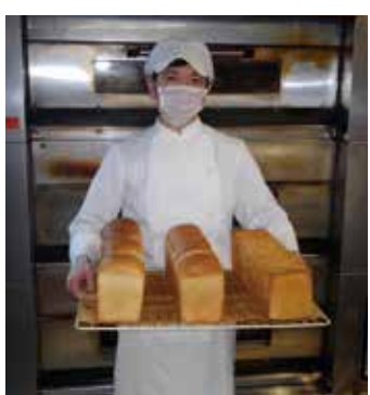
自社パン製造セクションもこだわりのひとつ