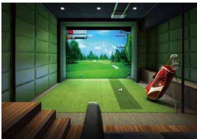
スーパーシミュレーションゴルフ「3D BIGBAN」設置例。画期的な臨場感を、ぜひあなたのご自宅で体感！

さらに、世界の有名コースを71種完全再現。屋内にいながら世界中のコースでプレイする爽快感を、ぜひともお客様ご自身で体験してください。