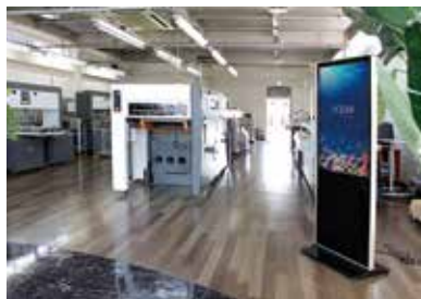
埼玉県八潮市のテクニカルセンター。同社の最新機器・商材を目の当たりに