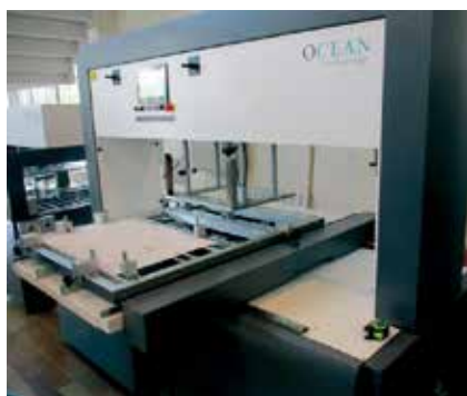
同社の自動落丁機

また、ハードウェア、ソフトウェアを販売して終わりではなく、その後の事業展開のアドバイスやコンサルティング、保守、点検といった複合的なサポートをしてくれる