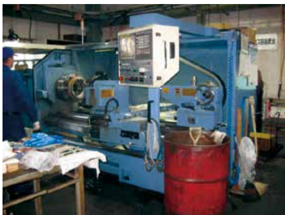
多様な機械が並ぶ自社工場

そして、同社の誇る技術力は熟練の人材が支えていることを常に忘れず、人材の育成にも余念がない。ベテランから若手従業員へ永年蓄積した技術を継承することにより、高い技術力を維持している。これからも、今までの実績・経験を最大限に活かしながら、良品質、低コスト、納期厳守を常に維持し、お客様に納得していただけるモノづくりを行っていく。