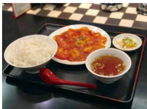
さまざまな定食が500円で！サラリーマンの強い味方