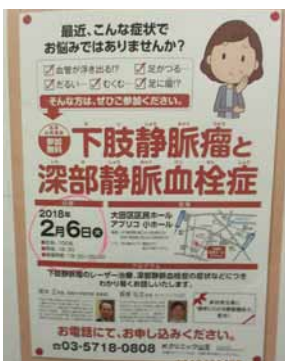
無料の公開講座も随時実施

設備に関しては、たとえば、患者様の苦痛の少ない経鼻内視鏡を導入していること。胃がんの早期発見には絶対必要な胃カメラを、「喉