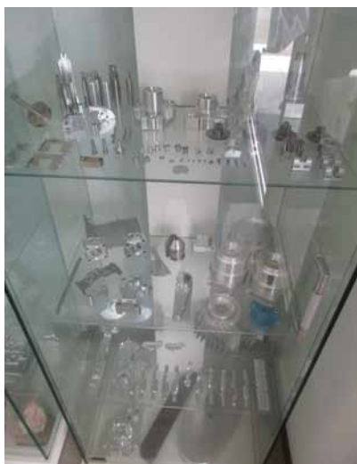
日々生み出される製品の数々に、同社の技術力が光る

福島工場では、マシンングセンタ・NC制御加工機、3DCAD・CAMが稼働しているが、平成29年12月より最新の5軸マシンングセンタ(500φの材料の切削を可能と