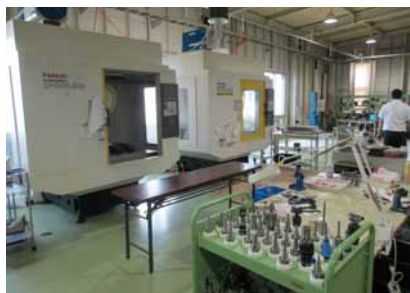
最新の設備を揃えた福島工場