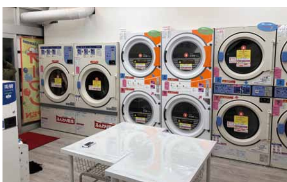
店頭も店内も明るく清掃が行き届き、気軽に利用しやすい

利用目的は実に多種多様。最近のコインランドリーでは、羽毛布団や毛布、カーテンにラグマットといった今までの洗濯機では洗うことができなかった大物も自分で洗濯することができ、費用もクリーニングに比べればとても安価だ。忙しい共働き世帯が1週間分の洗濯物を一度に洗濯・乾燥させて家事にかかる時間を節約したり、また、民泊利用者など短期滞在者も訪れる。さらに、見逃せないのがガス乾燥機。花粉、排気ガス、PM2.5などで外干しに不安を感じる方も多く、家で洗濯して乾燥だけというコインランドリーの利用も増えている。賢く使って、家事の時間や手間を節約できるのだ。