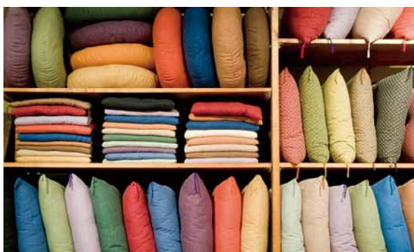
「寝具工房 いづみや」で、貴方だけのリラックスアイテムを見つけてください