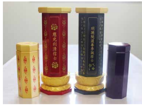
骨壺とご位牌を合体させた、新しい納骨の形「収骨位牌」