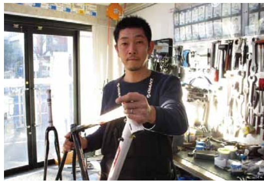
競技選手やメカニックとしての経験豊富な永井社長