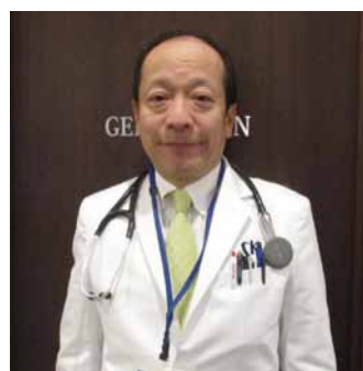
「ぜひお気軽にご来院いただき、健康不安を払拭してください」と菅院長

また、大病院との連携については、光ファイバーを通じて慶応大病院放射線科と連携し、放射線診断専門医による遠隔診断を行うので、「大病院レベルの診断を受けられる」と多くの患者様から満足いただいている。