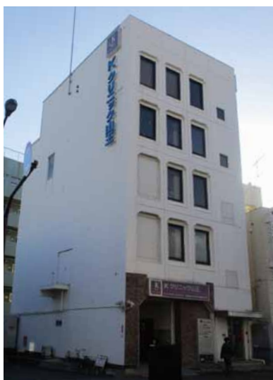
JR大森駅北口より徒歩6分、品川、大井町、蒲田、川崎方面からのアクセス良好