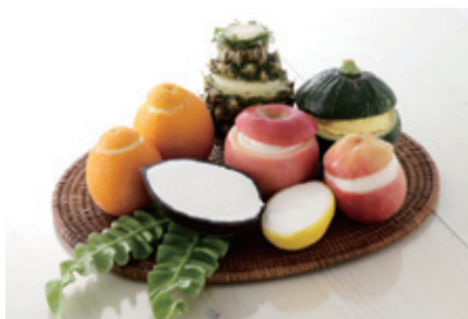
見た目も涼しげに美しく、サービスしやすい同社のアイスデザート。スイカやドラゴンフルーツなど、夏場に大活躍しそうだ

個人事業先でもお気軽にご利用できる1箱単位からの小回りの利いたデリバリー対応や店頭を華やかに彩る販促品(ポスター、メニュー、卓上POPなど)のご提供にも力を入れ、製品をより快適にご活用いただくアフターフォ