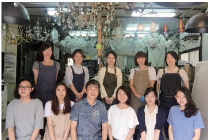
照明器具のことならオールウェイズへ!お気軽にご相談ください