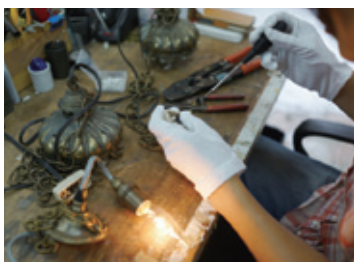
アンティークランプの修理・加工にも高い技術力を発揮