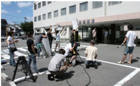
病院やマンションを活用したロケ撮影の様子

ロケ事業管理委託自治体：目黒区役所 同社管理物件：個人宅 154件（世田谷区 121件）、マンション 32棟、製鉄所 1件、各種工場 3件、病院 2件、その他事務所など約 30件