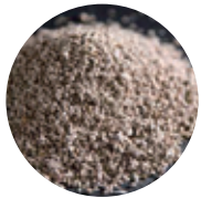
優れた調湿機能を持つ「メソポア珪藻土」

さらに、世界中の人たちにも胸を張って商品を提供したいという想いから、さまざまな研究・開発を経て生み出した環境改良材「MP抗菌珪藻土」で、特許を取得している。北海道地区のみで産出する高品質・高機能珪藻土