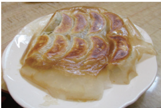
一番人気の羽根付き焼き餃子

し、小さなお子様連れのお客様も安心して食事いただけるように配慮されている。「餃子広場」の看板通り、同店一番のおすめは餃子。中でも、羽根付き焼き餃子が最大の売りという。餃子をはじめ点心の皮からすべて手作りしており、たつぷりの餡を包むモチモチとした皮の食感が絶品！