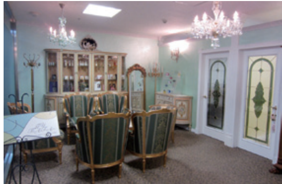
優美で華やかな事務所

オリジナルブランドや香水などのOEM事業、ローズ原料事業を展開する中で、注目はビューティー&ヘルスケアブランドのローズドレナーである。新しい文化として、飲むローズを推奨しており、原料として花香の女王「ブルガリアンローズ」を使用している。ブルガリア中央に位置するバラの谷で5月下旬から6月下旬にかけて3週間ほどしか咲かないという希少なブルガリアンローズを贅沢に使用し、水蒸気蒸留法によりローズウォーター、ローズオイルを抽出する。3.5〜4kgの花からわずか1mlしか採取することができない「液体の宝石」ローズオイルを、独自の蒸留方法で100%残留させたローズウォーターは、心と身体を活性化させ命を蘇らせるエネルギーを持ち、若々しい身体づくりに素晴らし