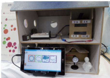
「全自動冷暖マット」(上段) / 「お天気通知ライト」(下段)の模型

同社の特長は、システム開発というエレクトロニクスだけでなく、各種センサー類やインターネット技術を組み合わせたメカトロニクス開発企業でもあること。自社製品として「全自動冷暖マット」(上段) / 「お天気通知ライト」(下段)の模型