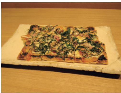
お勧め!ヘルシーな「油揚げのピザ」

スだけではなくカリフォルニア、レバノン、モロッコ、クロアチア、ジョージアなど珍しいものを仕入れ、また、ワインに合う料理を提案してくれるのも魅力の1つである。もちろん、雪の茅舎(秋田)、七田(佐賀)、川鶴(香川)、八鶴(青森)といった日本酒の品揃えにもこだわっている。