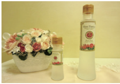
希少な「ブルガリアンローズ」を贅沢に使用した同社製品

い効果を発揮する。水や紅茶などほもちろん、サラダや肉料理、魚料理などに数滴加えて摂取できる手軽さも魅力的だ。山下社長自身も体調を崩したとき、ブルガリアンローズとの出会いで元気を取り戻した。