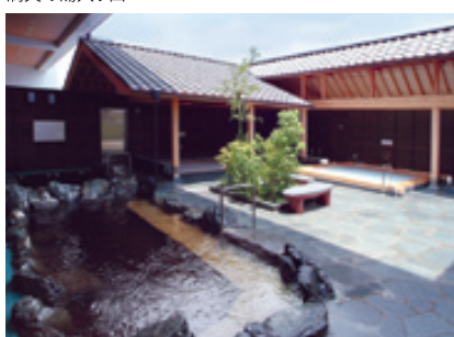
ノスタルジックな露天風呂

「素材にこだわり、体に優しく、旬・鮮度を大切にしてお菓子をづくりが当社のモットーです。自然の恵みを活かしてできるだけシンプルなおいしさを追求し、添加物を一切使用せず、お客様に安心して食べていただきたい」と社長は力強く語る。