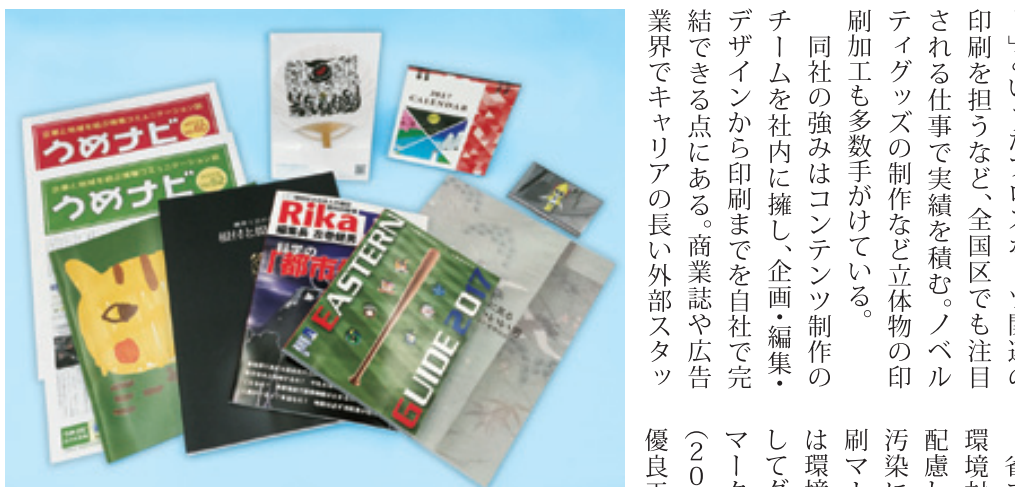
本紙「うめナビ」をはじめ、幅広い印刷物を手がける

省エネや資源再利用の徹底など環境対策にも注力し、森林保全に配慮したFSC®認証や、大気水質汚染に配慮したEPA環境保護印刷マーク認証、さらに自社製品には環境配慮基準を満たした製品としてグリーンプリンティング認証マークの印字も認められている。