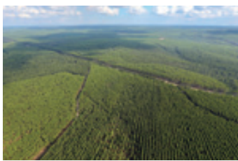
APPグループがインドネシアに所有する植林地

環境への徹底した配慮と安定供給、充実した製品群を背景に、日本でさらなるシェア拡大をめざしていく。