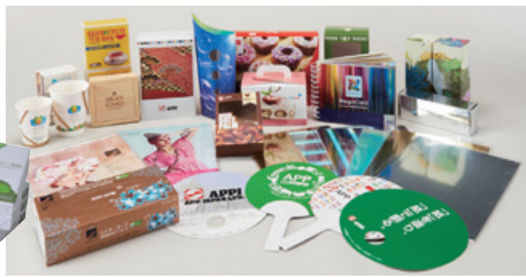
同社の取扱い製品

マップのもと、インドネシアと中国に所有する自社グループの森林で苗木から育て、収穫した木材を製品化する環境にやさしい生産システムを構築している。