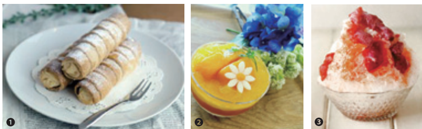
①特製のパイ生地にカスタードクリーム、まちだ名産品「つくしんぼ」②夏におすすめの「タヒチ」。マンゴーの彩りが鮮やか③オリジナルソースが人気のかき氷

クリスマス・お彼岸・ひな祭り・ハロウィン・お盆・母の日といったギフト用菓子も充実している。700円〜5,000円と幅広い価格帯や季節感あふれるラッピングも好評だ。誕生日や記念日用ホールケーキの特注文も受付し、子ども向けのキャラクターがデコレーションされたケーキは大人気！