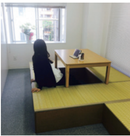
量のリフレッシュルームで仕事の能率もUP!

遊び心の一例として、今年4月に新設した事務所内のリフレッシュルームに畳スペースを採用。冬は掘りごたつで休憩することができ、社員がリラククスできる憩いの場となっている。マッサージュチェアも購入予定とのことで、仕事の疲れをマッサージュで手軽に回復させ、さらなる効率化を図る狙いだ。