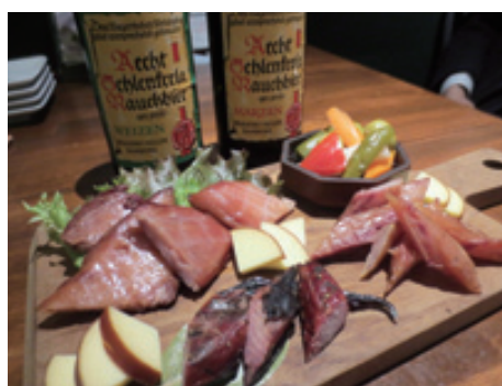
おすすめの燻製料理で、お酒も進む!

モーク料理の数々。また、2時間飲み放題のパーティーコース(3,500円)もある。 燻製料理とともに楽しむドリンクも豊富に揃っている。フルーティーな上発酵ビールや癖になる燻製ビールといったクラフトビールを中心に、全国のおいしいビール、ワインなどその時々料理に合わせたおすすめ銘柄の酒を店主に案内してもらえらるので、お酒に詳しい方もそうでない方も新たな発見がありそうだ。 良い雰囲気の中で寛いで飲みたい。そんな日にピッタリの、皆に自慢したくなるような一軒である。