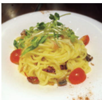
魚介の燻製入りペペロンチーノ

同店のおすすめメニューは、「魚介の燻製盛り合わせ」やパスタ、ピザ、アヒージョなどをギリギリカフェ風にアレンジしたス