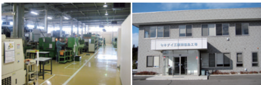
設備や人材育成面の充実を図る福島工場

Dを使った最新の5軸マシンニングセンターから手作業で削り出すフライス盤まで用途に応じて使い分けながら精度の高い切削を可能にし、機械だけでなく人の目を通した厳格な検査を徹底、口を最小限に抑えている。また、人材育成面においても積極的である。社員全員がすべての工程に従事できるような教育体制を整えるとともに、地元の雇用を促進することで福島の活性化に大きく貢献し、地元で高い認知度を誇っている。