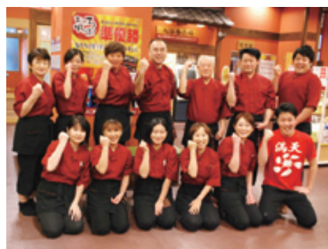
スタッフが「おふる甲子園」準優勝のおもてなしでお出迎え

木瓦屋根と木造軸組みの梁などノスタルジックな雰囲気。露天風呂は、琥珀色の「天然温泉岩風呂」、天然温泉と電気浴を組み合わせた「パルスマッサージバス」、畳敷きの寝転ぶ湯「うたた寝湯」などがある。内湯には漢方薬湯に高濃度人工炭酸泉が融合した「漢方炭酸泉」、どんな人でも浮き上がるジェット噴射によるパワーマッサージ「うきうき風呂」、美容院などで人気メニューの「炭酸シャワー」のほか、合わせて18種類のお湯を楽しめる。ゆつくりとおくつろぎいただけるよう広く開放的につくられた館内では、音楽イベント、ビンゴ、限定日替風呂、入浴剤教室などさまざまなイベントも行われ、常連客を飽きさせない工夫もしている。