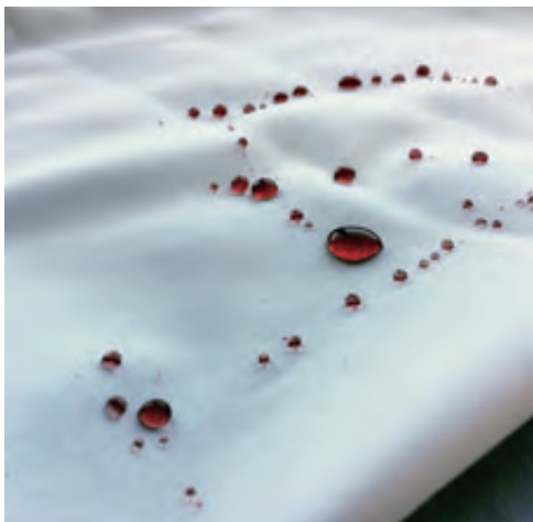
撥水機能の高さと素材感を両立させた N.18の B.Dシャツ。100/2のオックスフォード生地にコーヒー(右)と赤ワイン(左)の撥水テストを行ったもの

同社では、今後もさまざまなブランドとのコラボレーションを企画している。MADE IN JAPANのN.18は日本から世界へ羽ばたく。