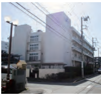
同社が入居している工業団地

現が非常に難しい微妙な色合いに對しての調整技術に高い評価を得ている。その技術力の確かさは、近年官公庁からの受注が増加していることから窺える。