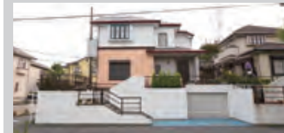
戸建てタイプ（横浜市青葉区美しが丘西）