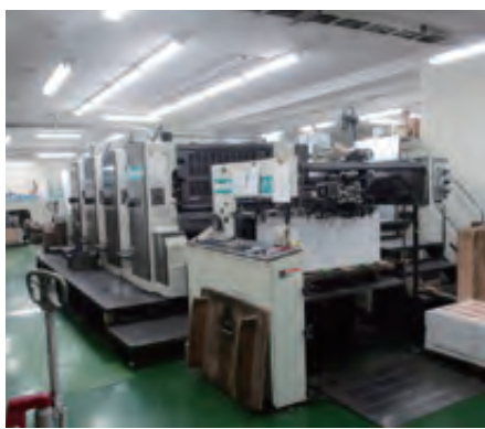
菊全四色刷印刷機

商品カタログ・パンフレット・ポスター・チラシ・DM・包装紙・名刺・カレンダー・各種シールなど、あらゆる紙媒体への印刷に対応可能であり、印刷に関する企画・デザイン段階からのご相談も承っている。もちろん完全デジタル対応なので、パソコンによるデータ作成やデータ入稿からの印刷にもフレキシブルに対応できる。また、同社は工業団地の建物の中であり、車ごと建物内に入って納品、受け渡しができるため、製品が雨に濡れる心配もない。そして建物内には製本会社も複数あり、印刷から製本まで同じ敷地内での加工ができるため、製品の管理も充実しておりスピードについても定評がある。 紙媒体への印刷のことなら、ぜひ当社にご相談ください。