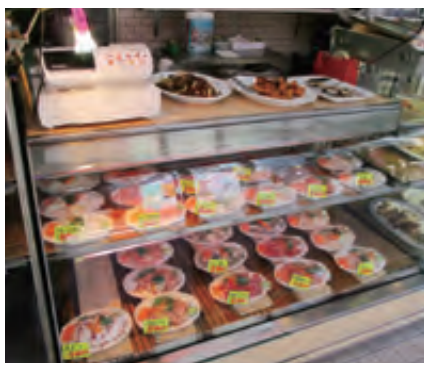
グローブのように大きな社長の掌で捌かれた魚たちが、今日も店頭で並んでいる

事業を継いだ母親の手伝いで、5歳から魚屋家業に関わってきた社長は76歳の今でも現役で、毎朝、横浜の中央卸売市場へと足を運ぶ。「20歳の頃仲間内で三輪自動車を買って、皆で市場に魚を仕入に行ったんだ。御用聞きに配達にと、よく手伝わされたよ」と当時を懐かしみながら、「お客さんがわざわざ魚春に買いに来てくれるのが嬉しくてねえ。もつと魚を食べてもらいたいんだよ。魚は健康に良いし、種類も調理方法もたくさん