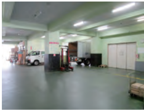
車ごと建物内での受渡可能

主な設備として、菊全四色刷オフセット印刷機2台、菊半裁五色刷オフセット印刷機1台を保有し、工場内の湿度管理にも気を配っている。高度な技術を持ったオペレーターとベテランの職人がお客様のさまざまなご要望にお応えしており、人間の肌色など表