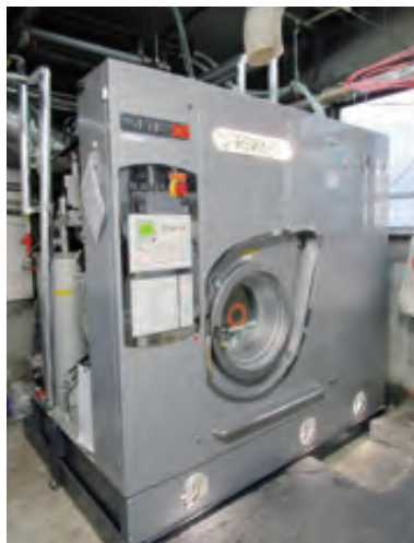
ドライクリーニングを行う最新設備

坂入社長は「家庭ではきれいにできないものをきれいにすることがプロのクリーンニング店の存在意義なので、品質へのこだわりは何より強い。大切な服をより多くの方が長く着られるよう、今後も汚れを落とすことへのこだわりは持ち続けていく」と力強く語っていた。