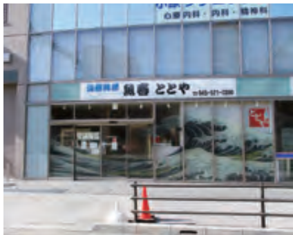
系列の海鮮料理店でも、魚屋ならではの新鮮な魚介メニューが人気

「商売は時代によって変わる。ただ切った魚を並べても、魚の良さは伝わらない。地域に必要とされるため、お客さんに喜んで魚を食べてもらえるように提供していく」と、社長は力強く語る。