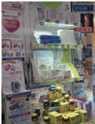
薬剤からスライムなどの実験キットまで、さまざまな商品が並んだ店内

スライムから地域医療まで、既に「総合薬局」として定着しているように見えるが、千葉社長は「これからも、身近に感じていただける薬局、最初に相談していただける環境づくりを続けたい」と意気込む。