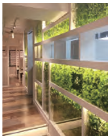
昨年オープンした「焼肉屋マルキ」下北沢店さわやかな空間を演出

そのほか「焼肉屋マルキ」下北沢店、「焼肉屋マルキ市場」吉祥寺店・千歳烏山店・中野店・八王子店・武蔵小山店、「焼肉屋マルキ市場NEXT」町田店の低価格業態7店舗を展開している。店舗ごとの顧客層に応じてメニュープランを変更し、老若男女幅広くご利用いただける店づくりに努めている。いずれの店舗でも単品価格を抑え、さらにたくさん食べた方には「食べ放題」がおすすめです。