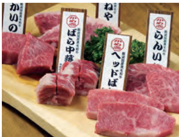
天晴れかめ壺の「黒毛和牛極上おまかせ盛」肉のおいしさを堪能！

同社のこだわりは、A4ランク以上の黒毛和牛肉をリーズナブルな価格帯でご提供していることだ。「新鮮な肉をタレとともに熟成させる」という発想から同社が生み出した「甕漬焼肉」。肉の旨みを逃がさないよう秘伝のタレに漬けてこむ絶妙な塩梅は、長年試行錯誤を重ねた熟練の技である。