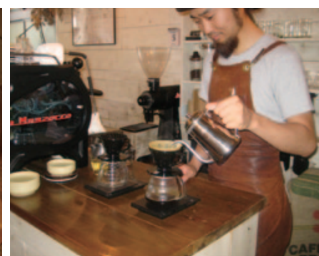
奥沢店の橋本店長。お客様との会話を大切にしている

が好評を博している。現在は、奥沢のほかに、道玄坂、外苑前、そして今年1月にオープンした中目黒と4店舗まで拡大している。店舗の場所によって客層は異なるが、お客様との近い距離感、お客様に合ったコーヒーを提供する姿勢は変わらない。「日常にとけ込んだ一杯、そんなコーヒーをお届けします」店内に置かれたポストカードにはこのようなおコメントが書かれている。奥沢店はもちろん、道玄坂、外苑前、中目黒に来た際は、ぜひお立ち寄りください。