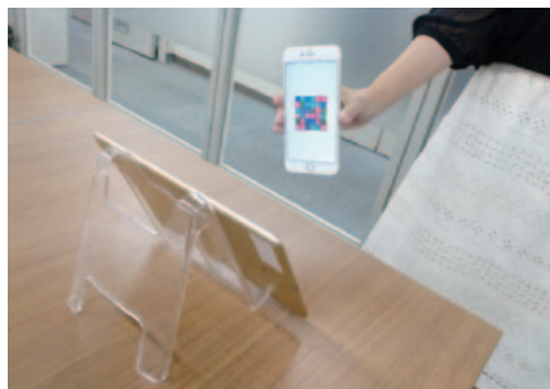
タブレットなどにリーダーアプリをインストールし、コードを読み込む

に模様が動く「動的コード」で、複製が不可能となっている点だ。成りすましを防ぎ、確実に個人認証を行いたい守秘案件や、不正なコピーを避けたい金券やコンサートチケットなどに代わる手段として有効と考えられる。 スマートフォンが普及が進む中、身近で手軽なセキュリティコードQUOMO®-IDの活用シーンを一緒に考えられるさまざまな業種、業態の皆様へ、ご興味をお持ちいただけましたら、ぜひお気軽にご一報ください！