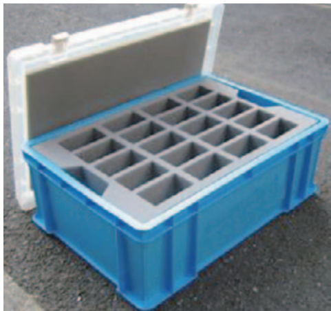
保護性能抜群のプラスチックコンテナ

その他にも、商品やパンフレットの展示にご利用いただけるオールダンボール製のディスプレイ台や、同社オリジナルのサイズ別ダンボールも12種類揃えている。オリジナルダンボールは常に備蓄しており、緊急時に即ご利用いただける体制を整えている。