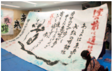
活発な部活動から自己成長につなげる

6年間で、自己肯定感と学ぶ楽しさを知り、自らの未来をデザインし、社会へと巣立っていく。