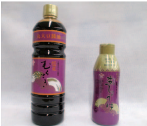
中野店主一押し「超特選むらさき」

特選」は、一般的な醤油と比べてうまみ成分の窒素分が20%以上多い商品のみ許可された表示である。厳選された材料でつくられ、長崎で永年愛され続けている商品ラインナップを店頭で購入できる同店へぜひ一度お試しいただきたい。