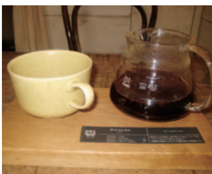
ルワンダの豆を使った、柑橘系の香りが楽しめる一杯