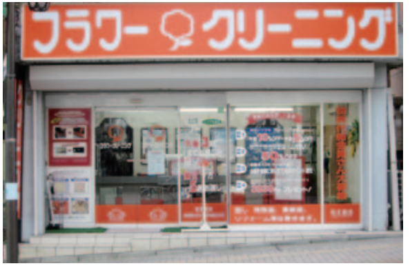
フラワークリーニング店頭

「フラワークリーニングでよかった!」とお客様に喜んでいただくという経営理念を第一に「クオリティ」「サービス」「ネットワーク」にこだわり、お客様に満足いただける仕上がりを目指し、一つひとつの工程を丁寧に行う。たとえば、「しみ抜き技術向上」のため、しみ抜き不入流(いらすりゅう)の資格を持つ社員が常駐し、他社員への指導を継続している点も同社の強みである。土日には店舗の前にてしみ抜きの実演会を行い、地域のお客様との触れ合いを大切にしながら、しみ抜きの実力を証明して信頼につなげている。