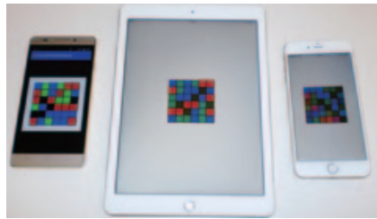
動画でコードをお見せできないのが残念！ 飲食店など、会員証代わりに