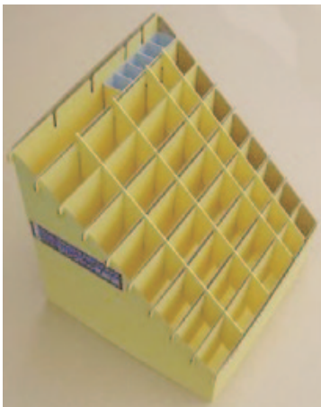
オールダンボール製のディスプレイ台