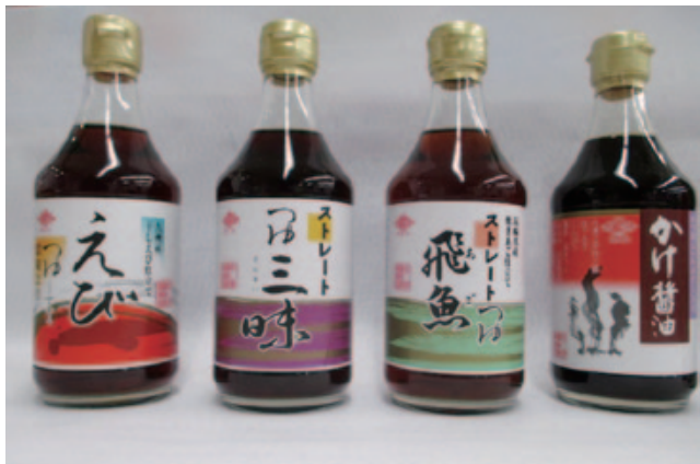
暑い時期にお勧め!チョーコーのつゆ

このチョーコー醤油を世田谷区で販売している中野店主は「区内ではあまり見かけませんが、他のものとは一味違ったこだわりの商品をもっと皆様にも味わっていただきたいです。醤油以外にもポン酢や味噌、めんつゆもお勧めです」と魅力を語る。