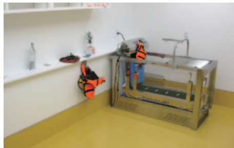
十分なスペースをとった院内設備