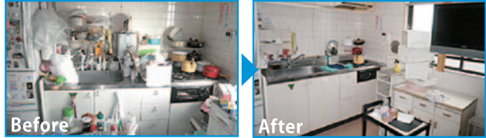
「らくらくキッチンリフォーム」