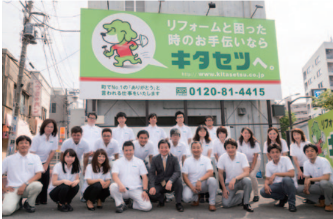
リフォームのご相談は私たちキタセツにお任せ!

身近な収納サービスにも力を入れ、住空間収納プランナーの資格をもつ社員が、お住まいの片付かない悩みを根本から解決に導く。キッチンリフォーム前後の片付けをパックにした「らくらくキッチンリフォーム」サービスも好評を得ている。また、お客様に金銭面でもご安心いただけるよう各種助成金の申請や手続き代行、国や自治体の助成金などの情報を迅速に開示し「今までこんなお得な情報を教えてくれる