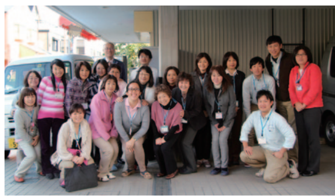
親身なスタッフが支える

経験豊富なケアマネジャーの作成したプランに基づいて、訪問介護サービスの「ヘルパーステーションめぐみ」では、毎月ヘルパー研修により熟練したホームヘルパーを派遣。利用者の方とご家族が安心して、より快適な生活を送れるようサービスの充実に努めている。