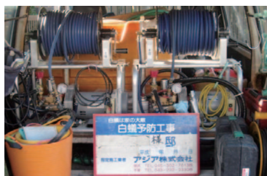
シロアリ駆除用具類

お住まいの害虫対策にお悩みの方、同社に少しでも関心をお持ちの方は、ぜひお気軽にご連絡を。共に働く同志の方も募集中です、お待ちしております！