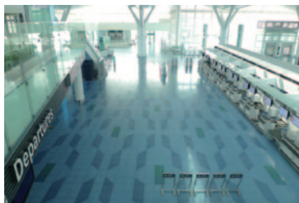
羽田空港 国際線ターミナル出発ロビー