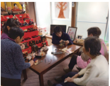
「ひな祭り」イベント

同グループは、今後もさまざまな在宅サービスを通じて、家族の絆を守ることに、人と人とお互いを信頼し合い、認め合い、尊敬し合う、そんな人間関係を築ける「人間愛あふれる地域社会」づくりに貢献し続けていく。