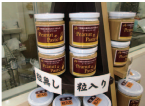
同店一押し「ピーナッツペースト」使いやすいサイズでまとめ買いされるお客様も

は、明治27年創業から120年を数える、青山唯一の老舗豆専門店である。東京メトロ銀座線外苑前駅からすぐの青山通りに面し、落花生、大豆、塩豆などの昔ながらの煎豆や落花糖、おのろけ豆、桜えび豆などの豆菓子、またお土産として贈り物や引き出物などの詰め合わせギフトも各種販売している。