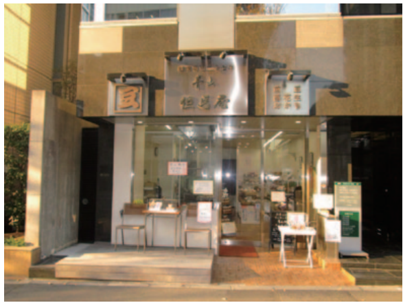
青山通り沿いの店頭