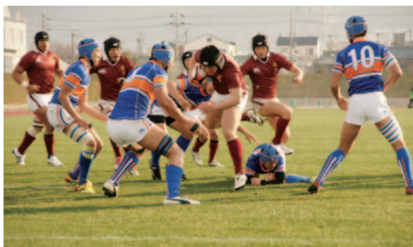
ラグビー強豪校である本校は、現在、幅広いキャリアデザインにも取り組んでいる