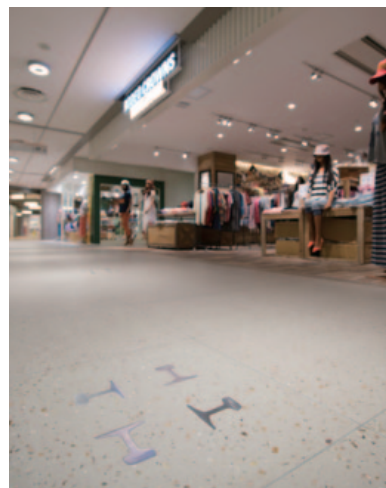
テラゾを使った床(東京スカイツリー)

地下街などの床も同社が手がけたもの。お出かけの際は、ぜひ足元の綺麗な床に注目してほしい。さらに、大理石やテラゾはテーブルやキッチンカウンタ、玄関床、キッチン床などの内装の部材にも最適な素材である。店舗改装や内装工事・リフォームなどをお考えの方はぜひ、この機会にご相談いただきたい。