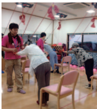
デイサービス「めぐみの家」