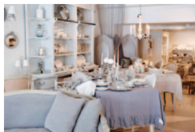
サラグレーススタイルを体験

開業、平成23年に南青山の実店舗を開店し、昨年は自由が丘に続いて、ブリリアントステイジをコンセプトとして新規オープンした商業施設キラリトギンザ内に銀座店を出店した。