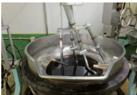
ヒット商品「昭和カレー」もこの大釜から!

を使用せず、安心しておいしく食べてほしい」という同社の想いがこめられている。人気No.1のたれは「焼鳥のたれ」。元祖「焼鳥のたれ」として、発売から40年余り、子どもから大人まで広く親しまれている日本人好みの味付けは、今も不動の超ロングセラー商品である。そして、同社の「たれ」は付けて食べるだけでなく、たとえば「焼鳥のたれ」なら鶏肉ソテーやブリの照焼、焼おにぎりといった他の料理のアレンジにも使えて食事のアクセントになる。