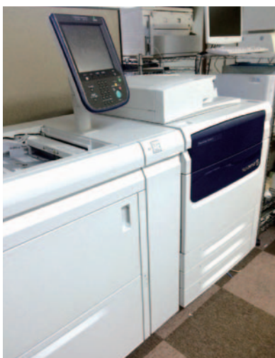
さまざまな顧客ニーズに対応できる プリントオンデマンド機器

近年の電子書籍普及やペーパーレス化などの時代の流れにより多様化した出版関連業界に合わせ、印刷業界でもさまざまな新技術が生まれている。必要なものを、必要な時に、必要な数だけ印刷するシステムであるオンデマンド印刷。フィルム製版、CTP刷版といったオフセット印刷に必要な工程を省略でき、同社ではデジタルデータを直接出力するデジタル印刷機を使用している。そのため、10部、50部といった小ロットの印刷物でも、速く・低価格で提供することができ。オフセット印刷と比較すると若干品質が劣ることもありますが、同社の最新鋭オンデマンド印刷なら十分な品質が得られる。