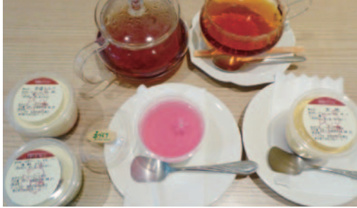
季節限定フレーバーもお勧めの「羽田プリン(大地)」