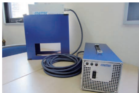
ハンディタイプで扱いやすい照射器

現在では、多くのハウスメーカーや内装工事業者などに採用されており、「塗料、照射器、施工指導の3つを組み合わせた、付加価値の高いシステムを一括で提供できることが、当社の最大の強みです」と咲間社長は力強く語る。ホームページでは、塗料や照射器の詳しい解説や事業パートナーとなる施工業者の募集などを掲載しているため、興味のある方はぜひアクセスしていただきたい。