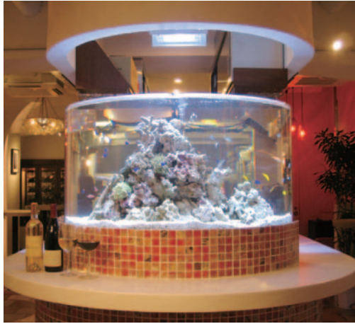
店舗内装をグレードアップ