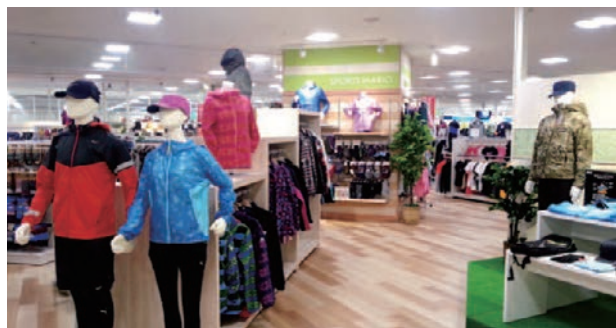
広々とした店内でお買い物(イオン橋本店)

そしてさまざまな事業の中で、現在、大好評を得ているというのがアクア事業である。これは水槽のあるインテリアデザインを通して、快適な癒しの空間を提供するというサービス。海水魚・淡水魚・熱帯魚などの鑑賞用水槽の施工・設置・管理はもちろん、魚の生体保持まで細部に至るメンテナンスを行っている。深く蒼い水の中で泳ぐ色鮮やかな魚たちがダイナミックかつ繊細な雰囲気演出し、オフィスでは忙しい仕事の合間を和ませ、ホテルやマンションのエントランスでは来訪者に安らぎを与え、自宅のリビングでは気分をリフレッシュさせてくれる。他にも、飲食店や病院などそれぞれの建物に合わせて、同社はあらゆる空間を自在にコーディネートする。