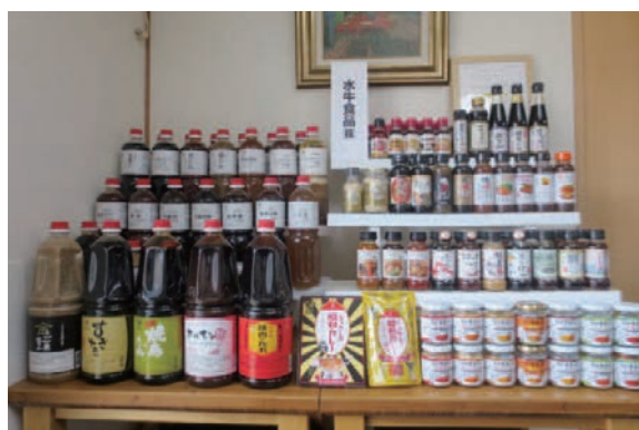
ずらりと並んだ同社調味料、おなじみの製品も数多い

特に、同社自慢の「たれ」には、国産有機原料しょうゆを使用し「素材や原料を厳選して化学調味料